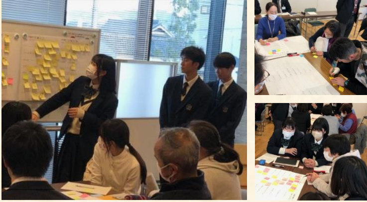
グループに分かれて検討し、発表を行いました。