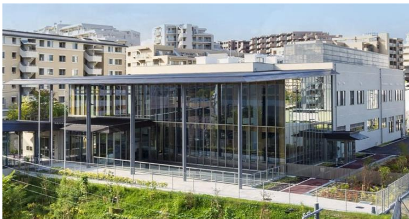
◎まちなかりビング 北千里

多世代が出会い、つながり、交流する場所として、吹田市が阪急北千里駅近隣の住宅街に整備した複合施設。児童センター、公民館、図書館が一体になっている。