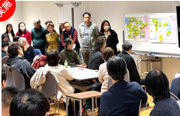
58人の市民が参加。施設の使い方を出し合いました。