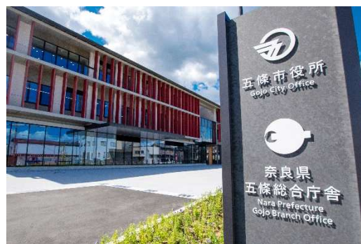
五條市役所（五條市岡口1丁目3番1号） ※JR五條駅から約500mです。