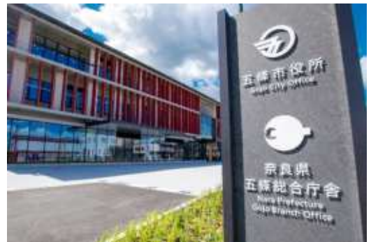
五條市役所(五條市岡口1丁目3番1号) ※JR五条駅から約500mです。