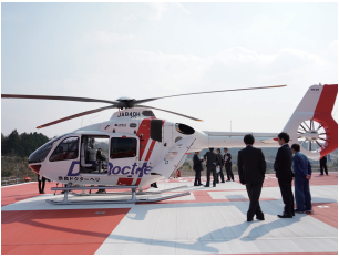
（奈良県ドクターヘリ）

議案審議では、平成28年度南和広域医療企業団病院事業会計補正予算（第2号）案、南和広域医療企業団職員定数条例の一部改正、南和広域医療企業団企業長等の給与及び旅費に関する条例の一部改正、南和広域医療企業団病院事業料金徴収条例の一部改正等6議案の説明を受け、総務委員会に付託しました。 続いて本会議が行われ、付託6議案について委員長報告を受け、採決の結果、全会一致で可決され、4月より再開院となる五條病院の視察を行いました。