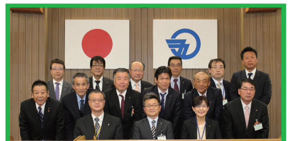
（退職された部長・次長の皆さんお疲れ様でした）