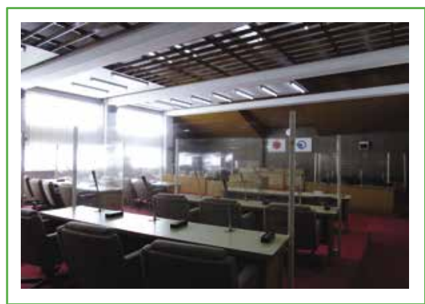
(議員席後方からの様子)