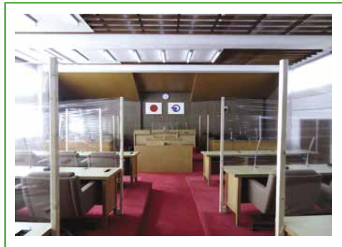
(正面から見た様子)