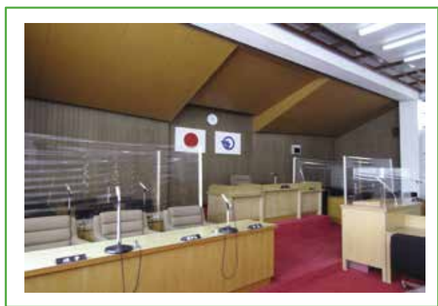
(市長席側からの様子)