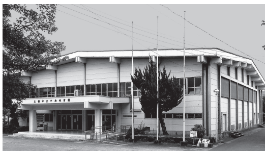
(五條市立中央体育館)

6月定例会で本委員会に五條市行政手続における特定の個人を識別するための番号の利用等に関する法律に基づく個人番号の利用及び特定個人情報提供に関する条例の一部改正ほか計2議案が付託され、審査の後、採決を行い可決されました。 委員会での質疑内容の一部を抜粋してお知らせします。