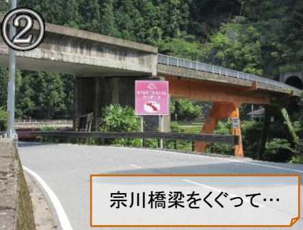
宗川橋梁をくぐって…