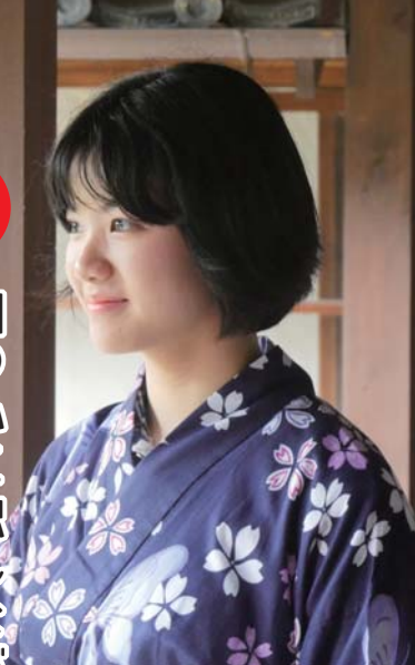
五條新町「まちなみ伝承館」の縁側で記念撮影する中国の学生