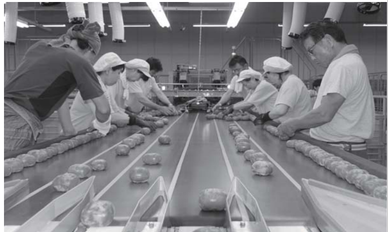
生産者と選果場の従業員が、傷などをチェック

五條市の特産品である柿の中で、一足先にハウス柿（刀根早生柿）の出荷が始まっています。今年の6月は、朝晩が冷え込み、秋のような気候だったため、ハウス柿の色づきが例年より進んだとのこと。選果初日の6月30日は、昨年の約4倍、4.5tが選果されました。