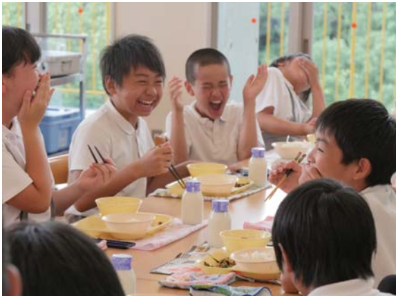
笑顔が絶えない給食タイム

生き物の命の大切さを心に刻んで食べてほしいと、市立小中学校等で、年に数回ジビエ給食が出されています。 今回の献立のメインはジビエ餃子。児童の1人は、「餃子も含めて、給食全部がおいしかった」と笑顔をこぼしていました。