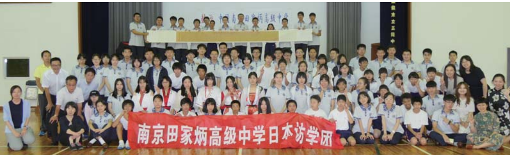
別れを惜しみながら、全員揃って記念撮影

五條中学校の生徒が、ゆかたの着付けを通じて「和の心」を学ぶ総合学習がおこなわれました。毎年恒例となっている学習ですが、今年度は中国からの修学旅行生（高校生）も特別参加。着付け体験の後は一緒に給食を食べ、携帯の翻訳機能を使いながら談笑するなど、国境を越えて友情をはぐくんでいました。