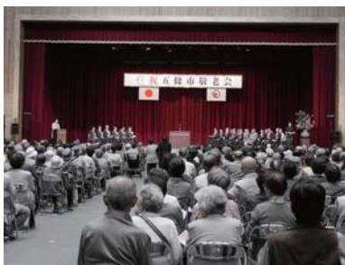
昨年の敬老会の様子