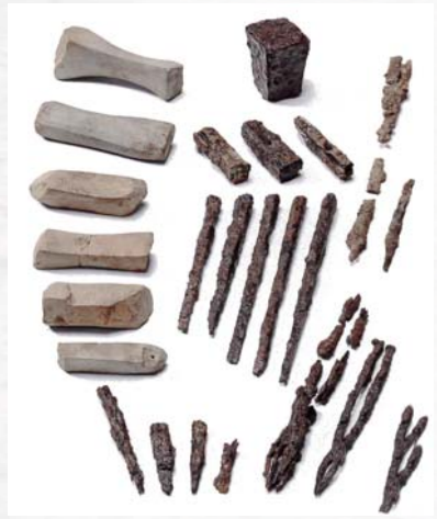
五條猫塚古墳出土の鉄製工具

また、その種類・用途も、武具(甲冑、武器(鏃・剣・鉾)、農具(鍬先・鋤先・鎌)、工具(斧・鑿・鋸・鉋・刀子・ヤスリ状・鉄鉗・鉋頭・鉄床・鑿)、漁具(ヤス・鉚)と多彩です。一部の工具には実際に使われた跡が見られますが、農具は「雛形」と呼ばれる小型の模造品でした。弥生時代に祭器に用いられた青銅よりも丈夫な鉄の工具は、古墳時代に多くの木製品や金属製品を生み出しました。例えば、猫塚古墳で出土した蒙古鉢形甕の底部分や、龍や三葉の文様の帯金具などは、金銅製の薄い板でできています。