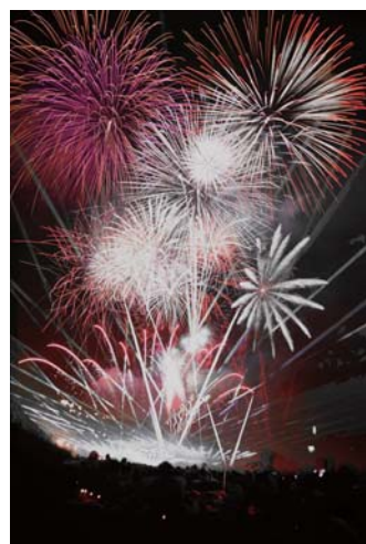
昨年の吉野川祭りの様子