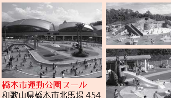
橋本市運動公園プール 和歌山県橋本市北馬場 454 ☎0736・33・2556