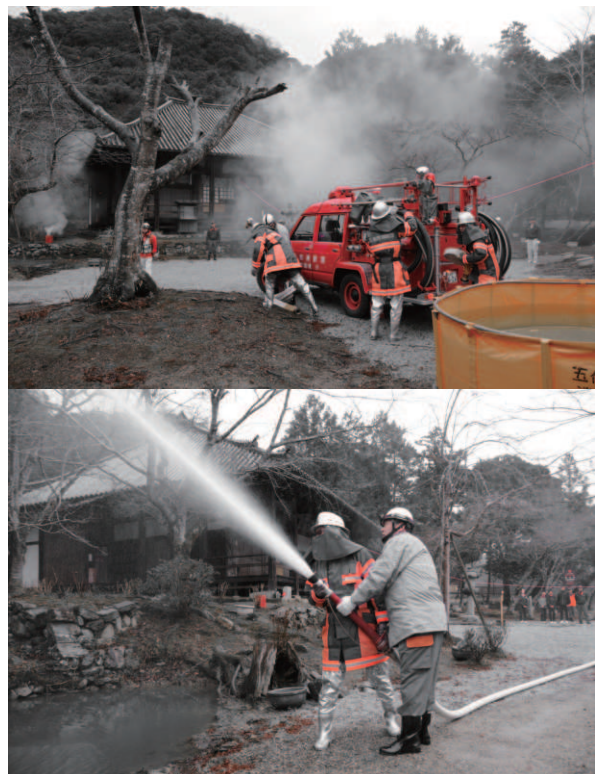
令和元年度に榮山寺で行った文化財消防訓練

五條市には国宝の榮山寺八角堂をはじめ多くの文化財があります。この機会に、文化財愛護の意識や、防火・防災意識の高揚に努めましょう。