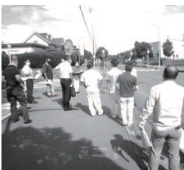
通学路の合同点検

学校・警察署などと構成する「五條市通学路安全推進連絡協議会」では、学校から報告のあった通学路の危険箇所を巡回し、合同点検を実施しました。今後は、それぞれの点検箇所ごとに対策に取り組む関係機関を決定し、通学路の交通安全の確保に向けた対策を進めていきます。