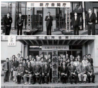
新庁舎開庁式と旧庁舎閉庁式

新庁舎は県下初の国・県・市の集約型庁舎として市民の皆様への利便性を高めるとともに本市の防災拠点としての機能や地域の賑わいを創出する機能を有しています。また、約60年にわたり市民生活を守る拠点としてあり続けた旧庁舎については、