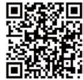
修繕工事は、HP掲載の業者に依頼しましょう。