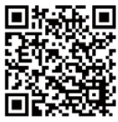
▶日本年金機構のホームページ

※「学生納付特例制度」・「納付猶予制度」は、承認された期間は老齢基礎年金を受け取るために必要な期間に算入されますが、年金額には反映されません。