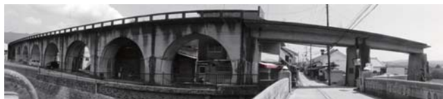
五新鉄道の陸橋跡 （新町1丁目）