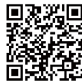
▲はっぴいのホームページ