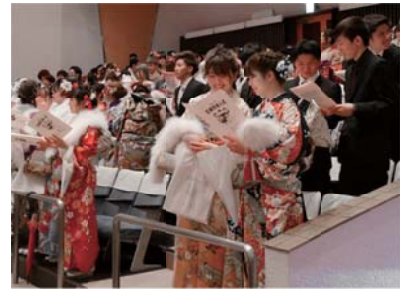
昨年の成人式式典