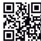
五條市地域商社(株)ホームページ