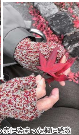
真っ赤に染まった楓に感激