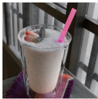
苺スムージー 税込 500円