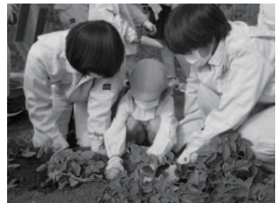
西吉野幼稚園児との芋ほり