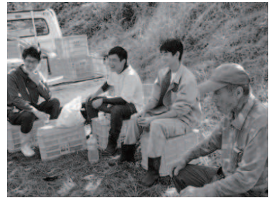
就労体験活動での語り

おかげさまで、実りの多い開校1年目にすることができました。今後も西吉野農業高校をよろしく願います。