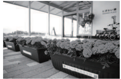
新庁舎開庁を寿ぐマリーゴールド