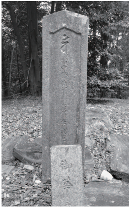
藤原武智麻呂墓 (小島町)