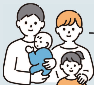
移住・Iさんご家族

子育て世代にとって非常に住みやすい環境が整っています。まず、吉野川や金剛山などの豊かな自然に囲まれ、静かな雰囲気が魅力です。また、こども園の選択肢が豊富で、待機児童の問題が少ないため、安心して子育てができます。さらに、車社会であるため、こども園の送迎や通院も車で便利に行えます。大型病院やイオンモールといった商業施設も移動圏内にあり、生活の利便性も高いです。