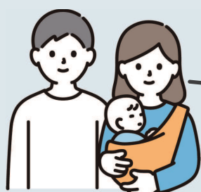
移住・Kさんご家族

子育て世代にとって非常に住みやすい環境が整っています。まず、吉野川や金剛山などの豊かな自然に囲まれ、静かな雰囲気が魅力です。また、こども園の選択肢が豊富で、待機児童の問題が少ないため、安心して子育てができます。さらに、車社会であるため、こども園の送迎や通院も車で便利に行えます。大型病院やイオンモールといった商業施設も移動圏内にあり、生活の利便性も高いです。