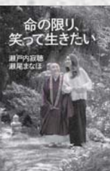
瀬戸内 敬蔵/著 瀬尾まなほ/著 光文社