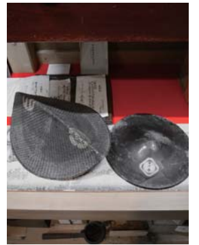
当時の兵士が身に着けた蕪山笠(藤岡家所蔵)

この命令を実行するという名目を掲げて、長州藩は、5月10日、本州最西端、下関の砲台から、眼前の関門海峡を通航するアメリカ、フランス、オランダの商船を次々と砲撃しましたが、