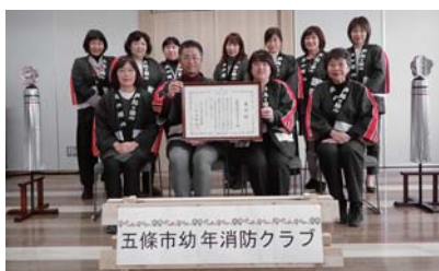
幼年消防クラブに参加する11園所の先生たち

本クラブは結成25年の伝統ある組織で、消防フェアの開催や、園所で実施される防火啓発、また、運動会等での防火演技を通じて防火・防災についての学習をすすめ、火事や災害から身を守る術や、命の大切さを学んでいます。