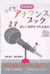
常世 晶子/著 茂木 亜希子/著 子どもの未来社