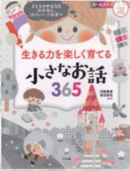
内野 美恵/監修 渡辺 弥生/監修 ナツメ社