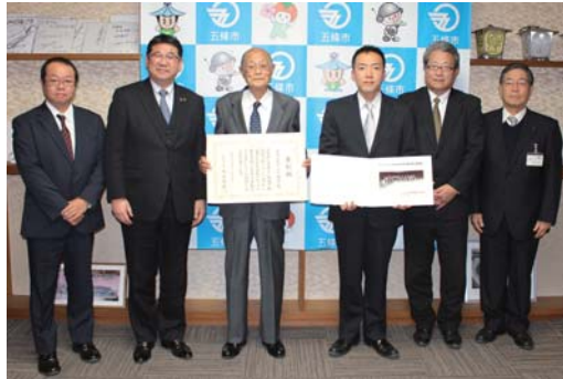
子ども達が地域の歴史・文化を学び、伝統の後継者を育成する活動が評価されました。