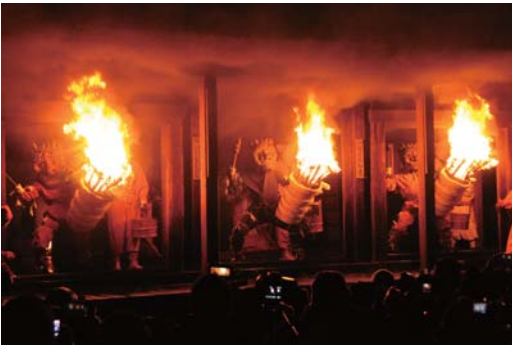
国の重要無形民俗文化財に指定されている行事で、当日は多くの参拝者等にぎわいました。