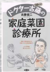
古藤 俊三/著 農山漁村文化協会