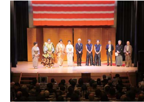
公演・演奏・講演会などを通じ、日本文化の質の高さと豊かさを紹介してくれました。