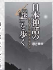
藤井勝彦/文・写真 天夢人

イザナキとイザナミの国生みの舞台、神功皇后ゆかりの地、聖徳太子が歩いた斑鳩の里。全国450か所以上の記紀神話伝承地を取材。テーマに合わせた36のルートを紹介しながら、古代史にまつわる様々な謎を解き明かす。