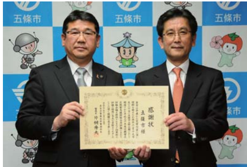
太田市長(写真左)と片桐奈良県警察本部警備部長(写真右)