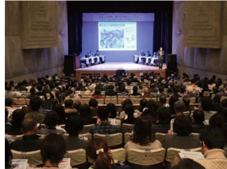
「誰もが健やかに暮らせる地域づくり」をテーマにパネルディスカッションを実施。