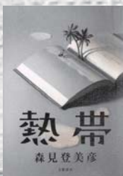
森見 登美彦/著 文藝春秋