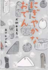
犬飼 由美恵/文 出口 かずみ/絵 教育画劇