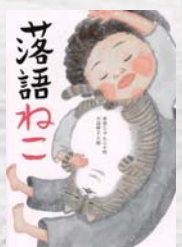
赤羽 じゅんこ/作 大島 妙子/絵 文溪堂

「心のこり」から成仏しそびれ、飼ひ猫にとりついた落語家の幽霊。でも「心のこり」を忘れてしまったから、ややこしい。その猫をおじいちゃんからあずかった、小5の七海は...。ドジな落語家と少女との笑い涙の物語。