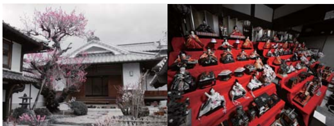
昨年3月の藤岡家住宅の様子