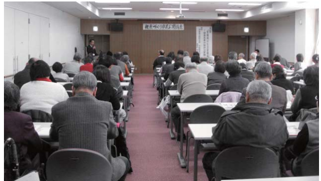
昨年の公開講座の様子