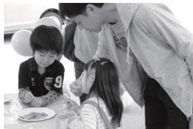
家族団らのひと時