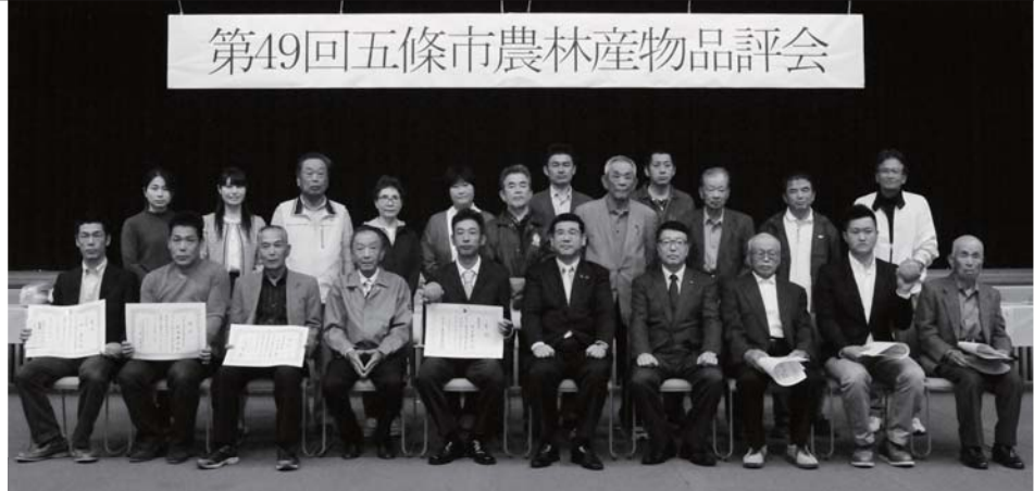
新宅実行委員長、太田市長、平岡議長と受賞者の皆様