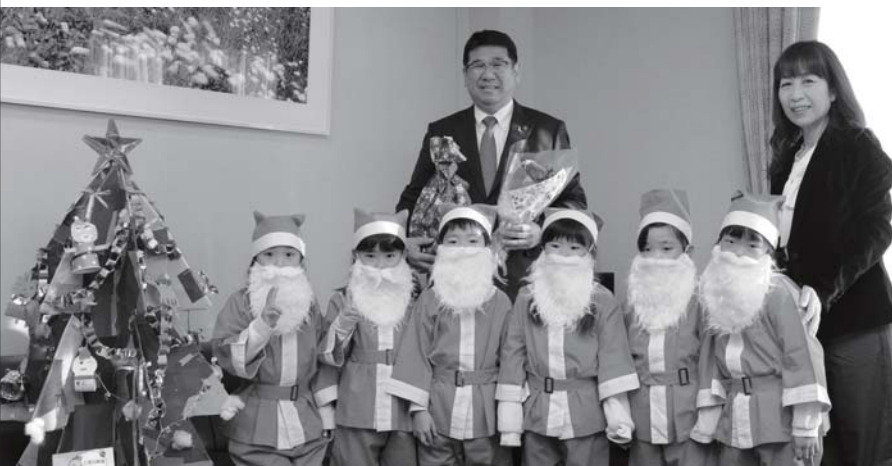
立派なひげの小さなサンタクロースたち

小さなサンタたちは、市長に手作りのクリスマスツリーなどをプレゼント。クリスマスには、子どもたちのところにもサンタさんが来てくれるといいですね。