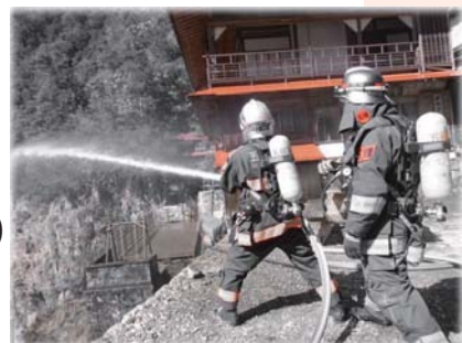
文化財防火運動合同訓練の様子 (平成29年度実施)

昭和30年の第1回文化財防火デー以来、毎年1月26日を中心に、文化庁、消防庁、都道府県、地域住民などが連携・協力して、全国で文化財防火運動を展開。今年も火災が発生しやすい1月23日(水)～29日(火)の時期に文化財防火運動を実施します。