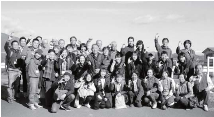
ピースサインの代わりに、コミュニティナースの頭文字「C」で記念撮影

奈良県による奥大和コミュニティナース養成講座が開催され、御山町自治会の皆さんが講座をサポートしてくれました。コミュニティナースは、地域の暮らしに寄り添いながら、住民の健康を見守る、一般の看護師とは異なった存在。御山町の皆さんが受講者に宿泊先を提供するなど、手厚くもてなしていただきました。ご協力ありがとうございました。