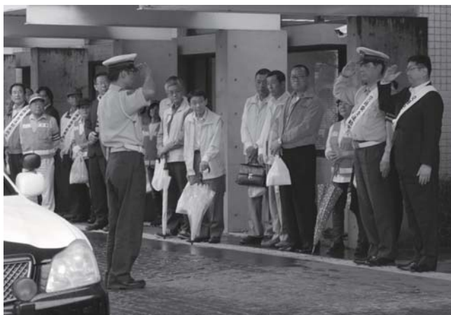
交通安全啓発パトロールの出発を報告