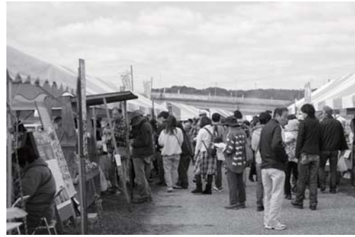
昨年の会場の様子