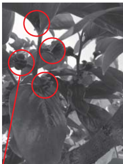
柿の蕾。一枝一蕾を目安に摘んでいきます。

柿の樹は、一本の枝に多くの蕾をつけます。この蕾の数を減らす作業が摘蕾です。蕾の数を減らすことで、栄養分の浪費を抑え、大きな柿が実ります。