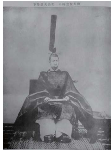
「御即位当時の明治天皇陛下」(『御大葬写真集』大正元年発行)