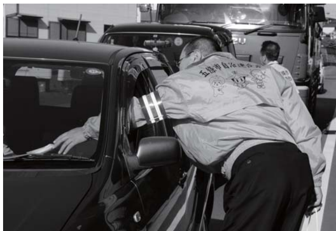
国道 24 号沿いで、啓発グッズを配布しながら交通安全を呼びかけ