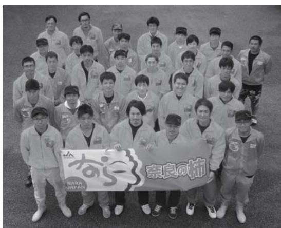
次世代の五條の柿を担う、西吉野柿部会青年部の皆さん