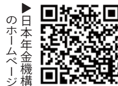
▶日本年金機構のホームページ