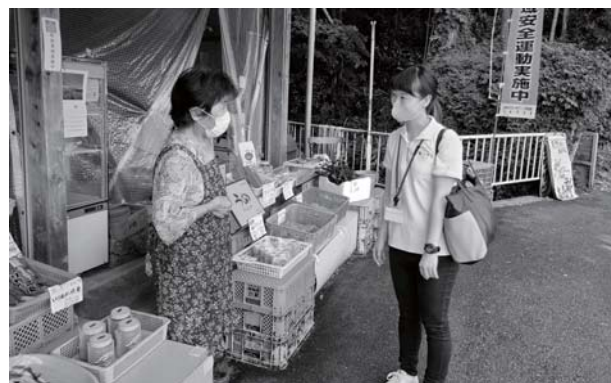
▲マスクを着用するなど、感染予防対策を行いながら訪問活動を続けています

消毒用アルコールを設置・保管する際は直射日光が当たらず、高温を避けた場所にするなど、設置する場所に注意してみてください。引き続き、咳エチケットや手指消毒を心がけ感染予防を行いましょう。