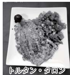
トルタン・タロン

One Point Lesson: “Masarap po!” “Tortang” “Talong” “Masarap” is a Tagalog phrase meaning delicious or tasty. “Po” is a form that indicates respect or politeness. “Talong” is an eggplant. “Torta” is Spanish slang for cake, omelet etc.