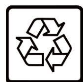
Li-ion リチウムイオン電池