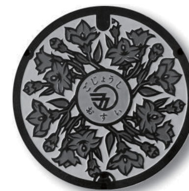
五條市のマンホール蓋。市の花「ききょう」をデザインしています。