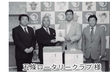
五條ロータリークラブ 様