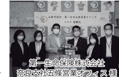
第一生命保険株式会社 奈良支社五條営業オフィス 様