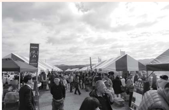
開場すると同時に、多くの来場者が行列を作りました。

近隣地域の生産者や職人が、作物や加工品を直接お客さんと交流しながら提供するイベント、今回で21回目を迎える「食の乱反射」が開催されました。天候にも恵まれ、会場となった吉野川河川敷には多くの来場者がつめかけました。来場者は目の前で調理される食材を見て、生産者と交流しながら食事を楽しみました。