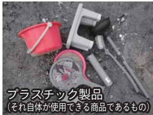
プラスチック製品 (それ自体が使用できる商品であるもの)