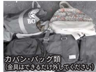
カバン・バッグ類 (金具はできるだけ外してください)