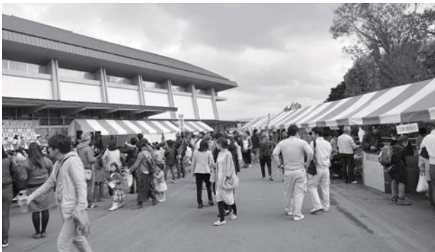
来場者は料理と音楽を楽しみました。

農地を荒らすため捕獲された野生のイノシシやシカを、ジビエ料理として楽しむ第1回全国ジビエ・フェスタがシダーアリーナで開催されました。全国のレトルトジビエカレーを食べ比べ、1番を決めるコンテストのほか、工夫を凝らしたジビエ料理の出店や、農作物の販売があり、来場者は様々なジビエの味を楽しみました。