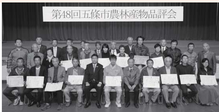
今回受賞された皆さん

市内の農業者が丹精込めて育てた農林畜産物が出品され、その品質を審査する品評会が総合体育館で開催されました。今回は1,140点の出品があり、審査員が色や形、品質を審査しました。厳正なる審査の結果、今回受賞されたのは次の皆さんです。※敬称略（品目）