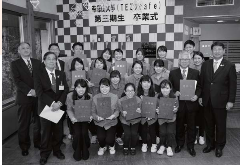
1年間の活動を終えた第3期生の皆さんと関係者

道の駅「吉野路大塔」での運営を第2期生から引き継ぎ、のど自慢出場や市内の小学生に対する食育イベント開催など、「市民に愛されるTEZUcafe」を