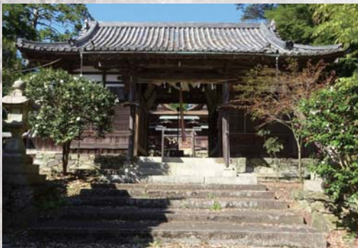
格致館のあった波宝神社

研精舎の開校から約1年後の明治7年5月、波宝神社の神饌所を利用して、「格致館」が開校しました。学区は、