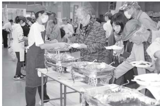
全国から集まった23種類のジビエカレーから4種類を食べ比べるコンテスト、多くの来場者が列を作りました。