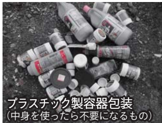
プラスチック製容器包装 (中身を使ったら不要になるもの)