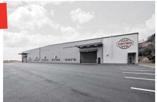
■ 問合先 企業観光戦略課 (内線 215)

株式会社 松徳工業所 奈良工場 (五條市出屋敷町 186-10 南大和テクノタウン内) ☎ 0747・25・0305