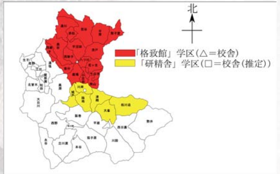
格致館と研精舎の学区

西吉野地域に創立された学舎の中で最も広く、旧吉野郷8村(百谷・湯川・赤松・平沼田・新子(現西新子)・奥谷・奥谷村大掘方・夜中)・旧御料郷5村(字唐戸・尼ヶ生・八ツ川・平原・梨子堂)・旧官上郷5村(汗入・汗入村越作方(汗入村とともに現十日市)・小古田・鹿場・南山)の計18か村を対象とし、唐戸には分館が置かれました。