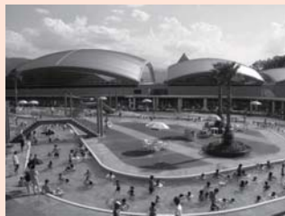
橋本市運動公園プール 和歌山県橋本市北馬場454 ☎0736・33・2556