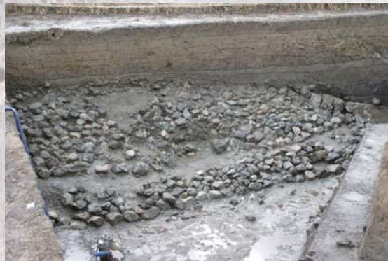
発掘された五條猫塚古墳の墳丘北西面の葺石

今年1月～3月、墳丘の北西側の休耕地に幅3メートル、長さ11～14メートルのL字形の調査区(70・5平方メートル)を設けて発掘し、埋もれていた墳丘の西角部付近と堤の斜面の葺石、堀を検出しました。