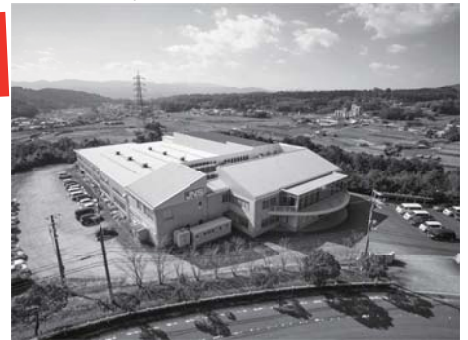
■ 問合先 企業観光戦略課（内線 215）

半導体設備・医療機器・食品機械他、クリーン用途・真空用途等、世界の最先端産業が必要とするベアリング。その製造には高い精度が要求され、私が担当する工程では1ミクロン単位でベアリングを加工しています。食品工場レベルのクリーンな環境で、技術と経験を駆使し、高品質な製品づくりに励んでいます。