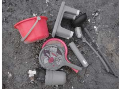
プラスチック製品 →燃えるごみ に入れてください