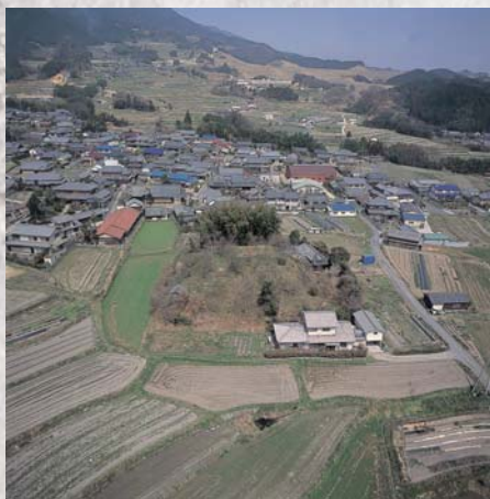
つじの山古墳(手前)と北宇智小学校 のある引ノ山(奥)(南から)

標高約250mの頂上近くにあつ た第7号墳(5世紀末頃の直径8m の円墳)の墳丘の真下に、古墳より も古い時期の土坑(穴)が二つ掘ら れていました。そのうちの一つは、 長さ1・48m、幅1・14m、深 さ0・4mで、底に炭化物が薄くた まり、その上の堆積土にも炭化物が 多く混じっていました。この土坑の