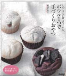
稲田 多佳子 / 著 学研プラス