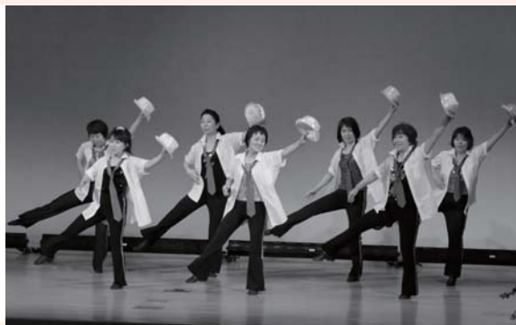
元気なダンスで会場を盛り上げました。