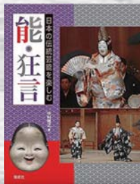
中村 雅之 / 著 偕成社