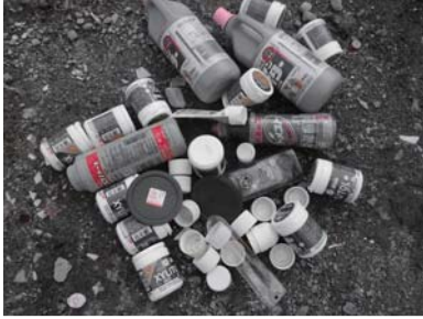
プラスチック製容器包装 →リサイクル類 に入れてください