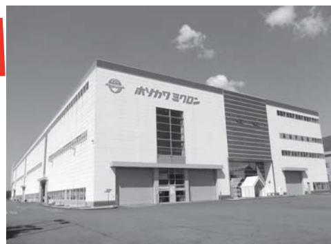
■ 問合せ先 企業観光戦略課 (内線 215)

ホソカワミクロン (株) 奈良事業所 (住川町1390番地 テクノパーク・なら工業団地内) 生産統括部 奈良工場 ☎26・3960 マテリアル事業部 五條工場 ☎26・6090