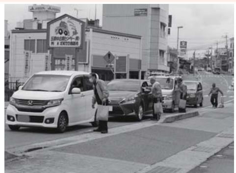
街頭で交通安全を呼びかけました。

4月6日から15日までの春の交通安全運動期間、五條市自治連合会の理事らが五條警察署とも協力し、市内の国道沿い数か所で歩行者やドライバーに、「気を付けて通行してください」と交通安全を呼びかけました。また同日、「気持ちよく五條市に来てもらおう」と、歩道などのゴミ拾いなどを行い、国道24号沿いの清掃活動に努めました。