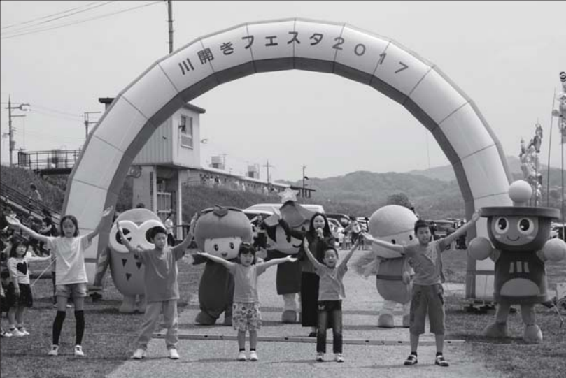
市内から集まったゆるキャラと子ども達によるダンス