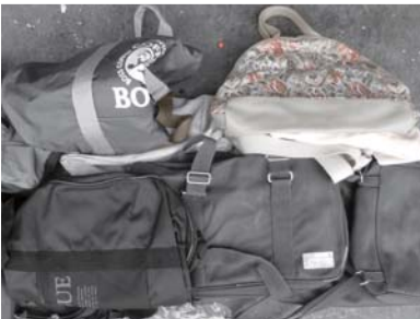
カバン・バック類 (金具はできるだけ外してください) →燃えるごみ に入れてください