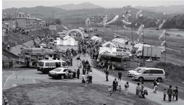
多くの家族連れでにぎわいました。

また、五條市のゆるキャラが大集合し、ダンスを披露するなど、多くの人々にぎわった1日となりました。