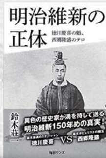
鈴木 莊一 / 著 毎日ワンス