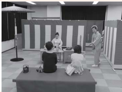
お茶席で来場者をおもてなし