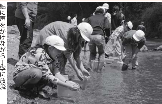
鮎に声をかけながら丁寧に放流