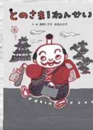
長野ヒデ子・本田カヨ子 / 作・絵 あすなろ書房