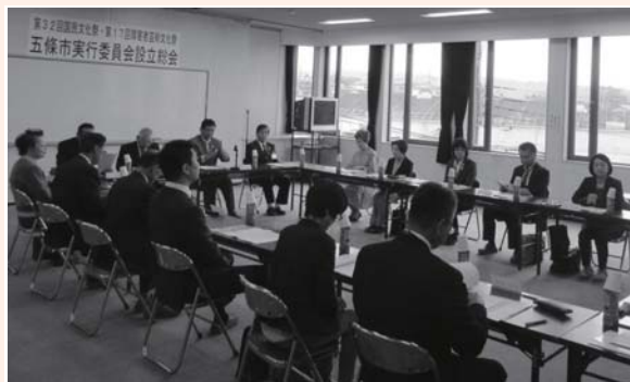
全国に五條市をPRする機会として事業を進めます。