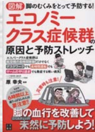
原 幸夫 / 監修 日東書院本社