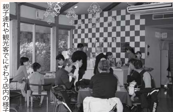
親子連れや観光客でにぎわう店内の様子