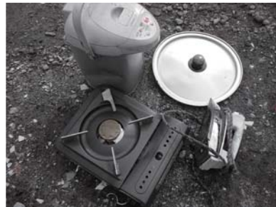
小型金属類 →カン・小型金属類 に入れてください

「 その他の燃えないごみ 」の分別について みどり園ではその他燃えないごみを再分別しています。実際に搬入されたその他燃えないごみの袋を開けると「燃えるごみ」や「カン・小型金属類」、「リサイクル用」が混入しています。きちんと分別すれば、処理費用の軽減や資源の有効利用につながります。分別に協力をよろしく願います。