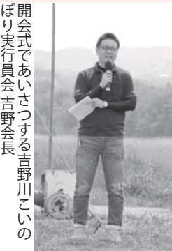
開会式であいさつする吉野川こいのぼり実行委員会吉野川会長

五條市の母なる川である吉野川河川敷で、雄大に泳ぐこいのぼりを見ながら川遊びシーズンのスタートの楽しいひとときを過ごしてもらおうと「川開きフェスタ 2017」が開催されました。会場では吉野川に生息する生き物の水族館コーナーや、五條消防署によるキッズレスキュー体験、五條警察