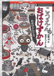
斉藤 洋 / 作 講談社