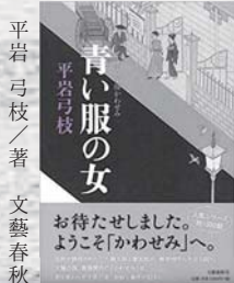
平岩 弓枝 / 著 文藝春秋