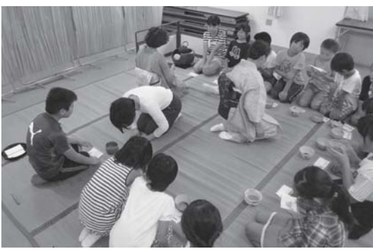
相手を思いやる心をお茶席で学びました。

野原小学校の3年生から6年生までの有志28人が、地域のボランティアの指導を受けて、茶道に挑戦しました。 子どもたちは先生から説明を受けた後、手本を真似ながらお菓子やお茶を楽しみました。生活様式の変化のために、お茶を味わう機会が減る中、茶道の体験から心を静め、相手を思いやる気持ちや、自然や伝統文化について学ぶよい機会になりました。