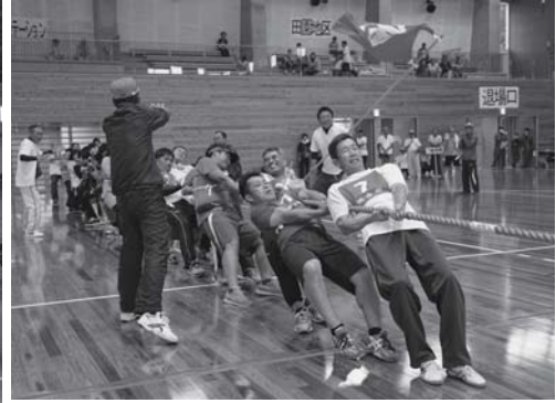
白熱の地区対抗綱引き