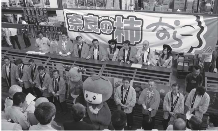
荒井知事らが東京大田市場で仲卸業者を前に奈良の柿の品質についてPRしました。

10/5 奈良の柿をPR 荒井知事太田市長ら 奈良県の特産である柿の消費拡大とPRのため、荒井正吾知事や中出篤伸JAならけん経営管理委員会長らがトップセールスのため東京大田市場を訪れました。 日本一の柿のまちである五條市からも太田市長、吉田義一JAならけん西吉野柿部会