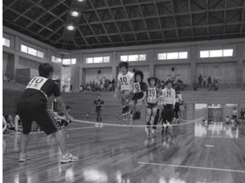
拍手と笑いのジャンボ縄跳び