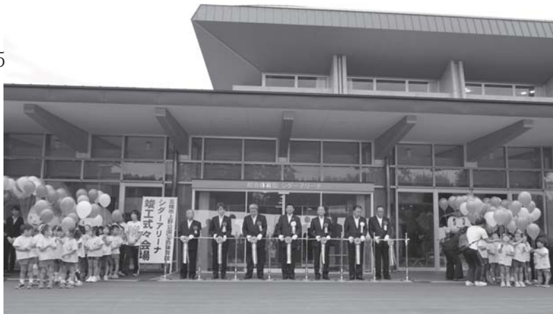
竣工式に先立って、テープカットとバルーンリリースが行われました。

五條市上野公園総合体育館（愛称・シダーアリーナ）の竣工式が行われました。体育館は鉄筋コンクリート・鉄骨・木造の混構造で、県産材の杉・桧2600本分の木材を使用したトラス構造の屋根や、自然豊かな上野公園の風景一望できるガラス張りの舞台壁などが特徴となっています。