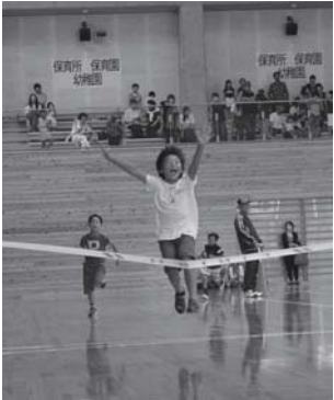
小中学生の記録会