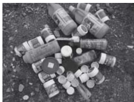
プラスチック製容器包装 (中身を使ったら不要になるもの)