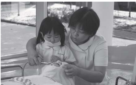
なりきり歯医者さん体験は子どもたちに大人気

また、フッ素塗布コーナー、なりきり歯医者さん体験、デントラルラーニングなどのイベントを通じ、親子で楽しく歯と口腔について学ぶ機会になりました。