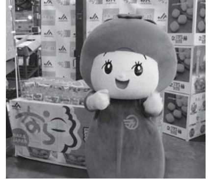
カッキーも柿をしっかりPRしました。

長らが参加して「刀根早生」の試食や配布を行って品質をPRしました。 五條市では「刀根早生」「平核無」「富有」と12月まで柿の出荷で忙しい時期が続いていきます。