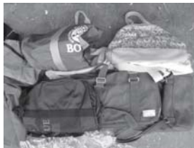
カバン・バッグ類 (金具はできるだけ外してください)