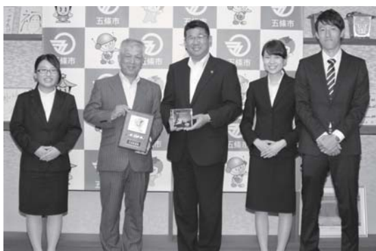
27日受賞を報告するために市役所を訪問した河合ゼミのみなさん