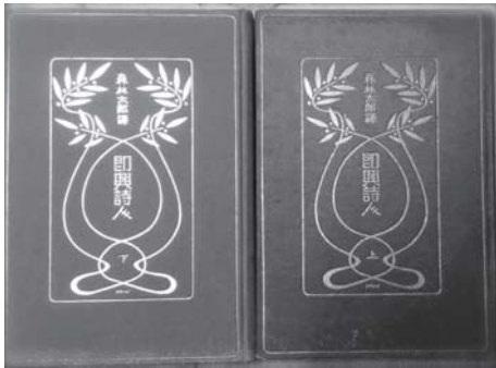
『即興詩人』(上・下) 森 林太郎著 春陽堂

明 治5年(1872)に発行された『童蒙教へ草』は、福沢諭吉によって、日本で初めてイソップが紹介された本として有名です。福澤は、江戸時代末期の万延元年(1860)年、咸臨丸に乗ってアメリカに渡り、ウエブスターの辞書を購入しました。その辞書を使って、イギリスの「ザ・モラル・クラス・ブック」という子ども向けの道徳の本を翻訳し、「学問のすゝめ」と同じ年に出版しました。全5冊の内2冊が藤岡家の蔵から発見されています。 巻 の一「動物を扱ふ心得の事」は、「世の中にかえる ででむし(でんでんむし)いもむしなどいふ虫あり 罪もなき身のなかに 心なき人ハ見付次第にこれを苦しめこれを殺すことあれども もつての外(ほか)の事なり」(注・句読点なし)と、小さい命を尊ぶことを、福沢諭吉流に説いています。 森 林太郎訳『即興詩人』は、アンデルセンの最初の長編小説を森鷗外(本名 林太郎)が、10年がかりでドイツ語から翻訳し