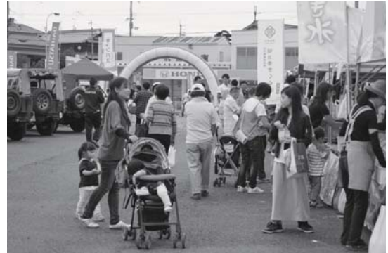
新鮮な野菜や果物などに多くの来場者が集まりました。