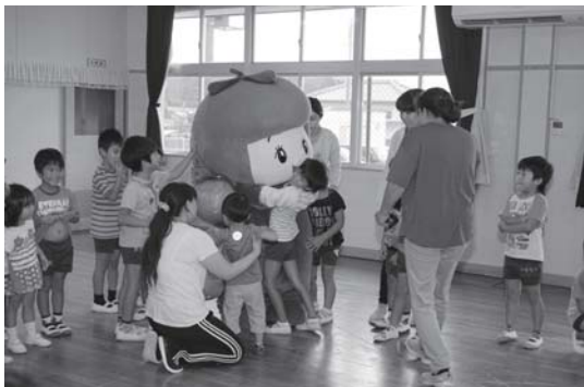
ゲームやダンスをしながら、柿について勉強しました。

その日の給食には「柿と大根のサラダ」が登場し、園児たちは美味しく食べながら柿の栄養などを学びました。