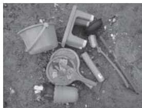
プラスチック製品 (それ自体が使用できる商品である物)