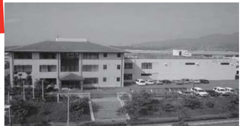
■ 問合先 企業観光戦略課 (内線 215)

広陵化学工業株式会社 五條工場 (住川町 1312 番地 テクノパーク・なら工業団地内) ☎ 0747・26・3311