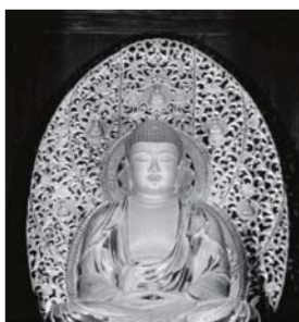
榮山寺の薬師如来坐像