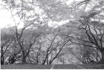
樹齢200年といわれる華蔵院跡のみみじ

☎32・9010 メール anounosato-museum@ken.jp ※月曜日・祝日の翌日休館