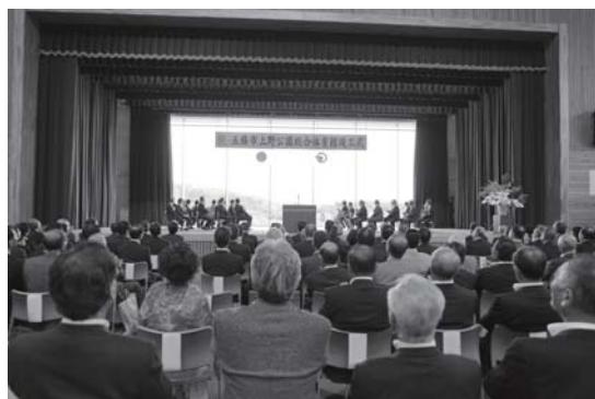
舞台後部の幕が開き、風景が見えると歓声が上がりました。

また、式中では、シダーアリーナや芸術家が誕生し、活動の拠点となってほしい。」とあいさつしました。