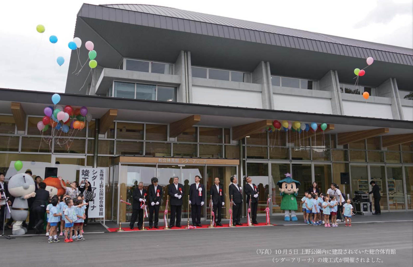
(写真) 10月5日 上野公園内に建設されていた総合体育館 (シンダーアリーナ) の竣工式が開催されました。