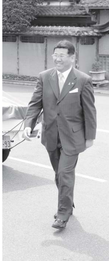
2期目のスタートです。

4月26日の市長選挙（無投票）により再選を果たした太田好紀市長（53歳）。同月28日に2期目の初登庁を行い、市役所の庁舎前で市民の皆さんや市職員の出迎えを受けました。