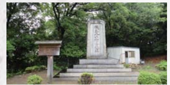
後藤又兵衛基次之碑

その後、二条城に戻った家康は、諸法度を発布し、幕藩体制の基礎となる制度を整えました。