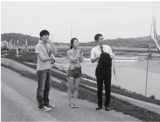
吉野川河川敷でポスターの写真撮影を行う出演者。

公開に先立ち、映画のポスターの写真撮影のため出演者やスタッフが韓国から来日。新町通りなど、ロケ地を巡りました。撮影のかたわら「五條で、もう一度食べたいもの、行きたい所がたくさんある」と滞在を楽しんだようです。映画が上映されることによって、市の魅力が海外にも広く発信されます。