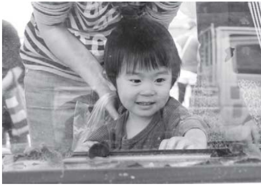
「こんな魚が吉野川にいるの？」と興味津々です。