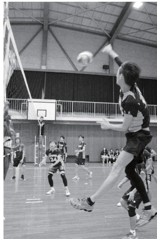
男子バレーボールの迫力あるスパイク。