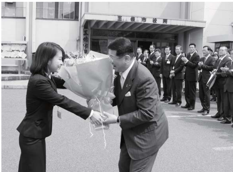
市民や市職員に出迎えられる太田市長。