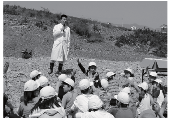
市職員から鮎の生態を学びました。

阿太小学校の生徒47人が、西阿田の吉野川河 川敷で鮎の稚魚の放流を体験しました。この行 事は小学校の総合学習の一環として行われてい るもので、今年で4回目になります。放流され たのは体長約10センチメートルの鮎の稚魚約4 000尾。子どもたちは鮎の生態などを学んだ 後、鮎を川にそっと放しながら、吉野川の清流 で大きく育つよう願いました。