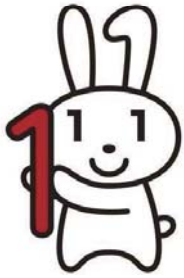
マイナンバーキャラクター マイナちゃん