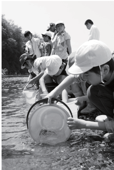
そっと鮎を放す子どもたち。

阿太小学校の生徒47人が、西阿田の吉野川河 川敷で鮎の稚魚の放流を体験しました。この行 事は小学校の総合学習の一環として行われてい るもので、今年で4回目になります。放流され たのは体長約10センチメートルの鮎の稚魚約4 000尾。子どもたちは鮎の生態などを学んだ 後、鮎を川にそっと放しながら、吉野川の清流 で大きく育つよう願いました。