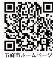
五條市ホームページ

食堂スペース 出展者を募集します ■期間 7月から9月まで ■問合先 企業観光戦略課(内線210)