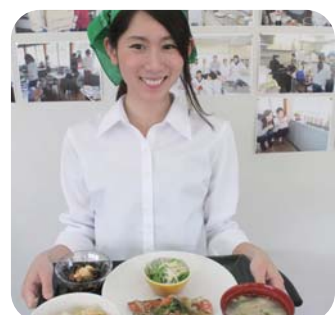
ヘルシーな和食、中華定食も用意しています。