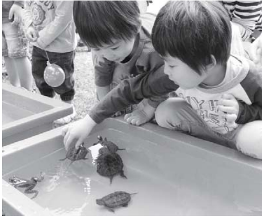
魚やカエルの水槽は子どもたちに大人気。

はじめマスコットキャラクター6 体が集合してダンスを披露するな ど、会場は子どもたちの笑顔であ ふれていました。