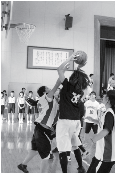
女子バスケットボールのゴール下の攻防。