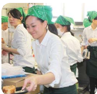
栄養価をしっかり計算。