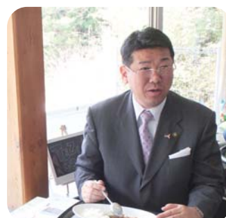
太田市長も「おいしい!」と太鼓判。シカ肉がある時限定の大塔カレー。