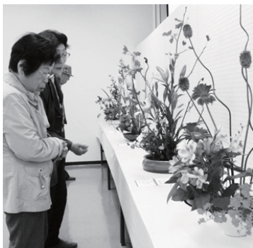
いけばなの力作に足をとめる来場者。