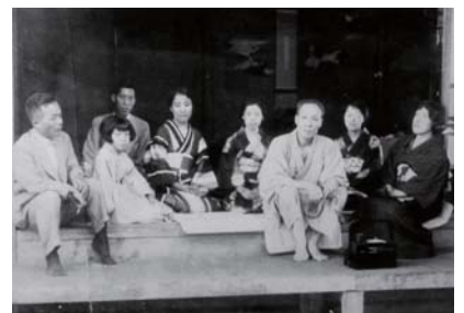
写真:高野山真如院にて与謝野晶子、与謝野鉄幹、高橋英子、石井長衛ら

毎週月曜日休館(月曜が祝日の場合は翌日) 入館料(大人300円、小人200円) ■藤岡家住宅 ☎22・4013(近内町526)