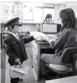
市役所で交通安全を呼びかけるキッズポリス。