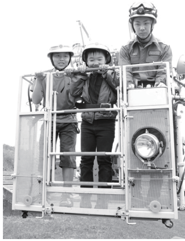
消防署のはしご車に乗れるコーナーも。