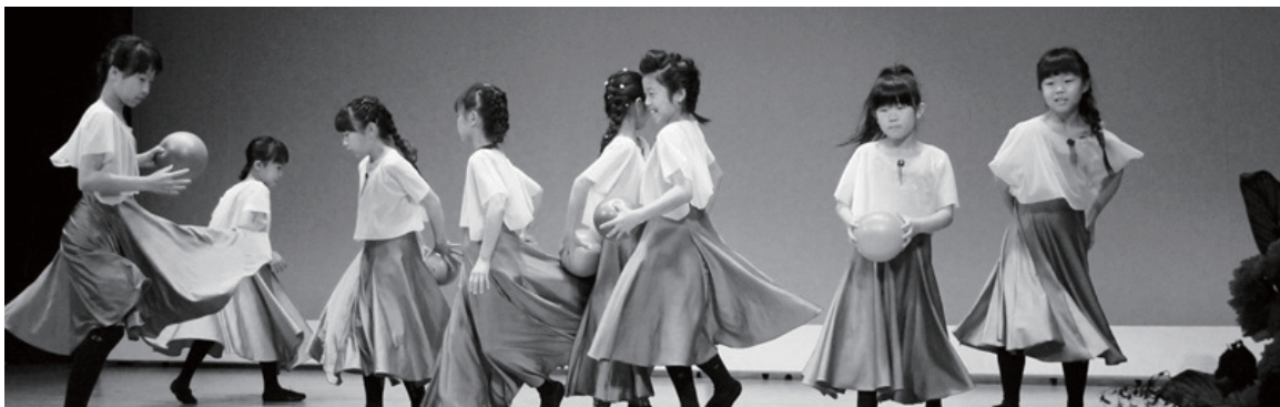
練習したダンスを披露しました。