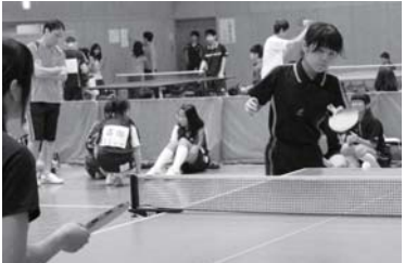
卓球には多くの選手が参加しました。