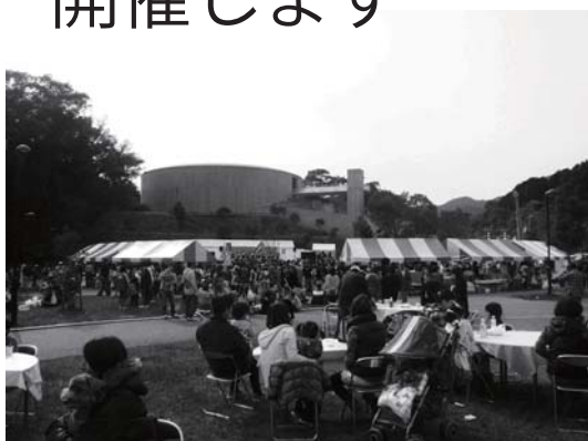
昨年の会場のようす(今年は阿田峯公園で開催します)