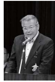
谷向自治連合会会長があいさつ

平成25年度五條市自治連合会定期総会が市民会館で行われました。総会では新役員の紹介や自治功労者の表彰、予算審議などが行われました。