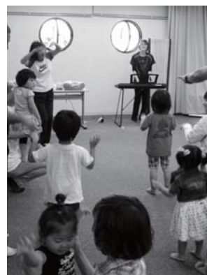
歌や手遊びも楽しみました

親子でいろいろな事に取り組みながら交流し、お父さんに楽しく育児に参加してもらおうと開催しているイベント「パパサロン」。今回は保健福祉センターで「パパクッキング」として開催し、2歳から5歳までの子どもたちと父親の7組、16人