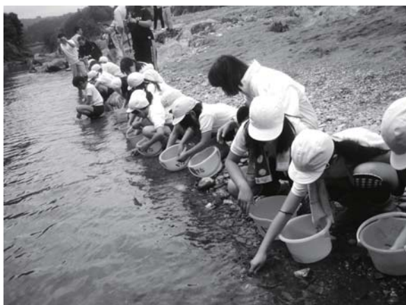
「元気に大きくなってね」と子どもたち

阿太小学校の児童68人が、西阿田の吉野川河川敷で鮎の稚魚の放流を体験しました。 放流されたのは五條市漁業協同組合の皆さんが用意した約3000尾の鮎の稚魚で、体長は約10センチメートル。子どもたちは鮎を川にそっと放しながら、吉野川の清流で大きく育つようお願いしました。