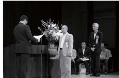
太田市長から自治功労者の皆さんが表彰されました