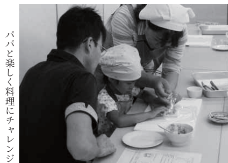
パパと楽しく料理にチャレンジ

親子でいろいろな事に取り組みながら交流し、お父さんに楽しく育児に参加してもらおうと開催しているイベント「パパサロン」。今回は保健福祉センターで「パパクッキング」として開催し、2歳から5歳までの子どもたちと父親の7組、16人