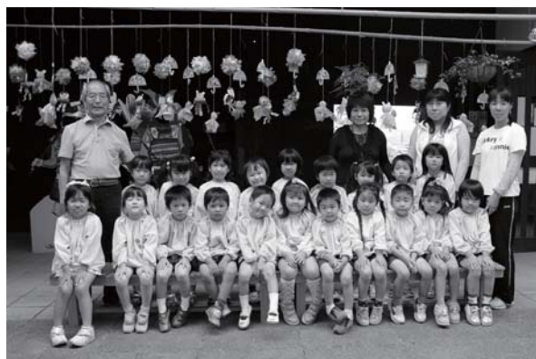
長屋門が明るく元気な雰囲気