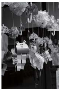
7月中旬まで飾られる予定です

南宇智保育所の園児が手作りした、人形や花の飾りなどのアクセサリーが民俗資料館長屋門にプレゼントされました。梅雨をイメージした可愛い飾り付けは7月中旬まで長屋門の入口に飾られ、訪れる観光客を明るく迎えています。