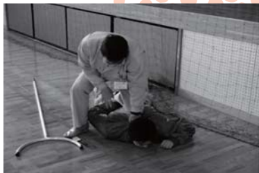
実践さながらの講習

子どもたちの安全を守るため、五條警察署員と市危機管理課職員との指導のもと、阪合部小学校で児童87人と教職員14人が参加して不審者侵入訓練が実施されました。五條警察署員が不審者に扮し「子どもに会わせてくれ」と学校を訪れて刃物を出して暴れたという想定で、駆けつけた教員が刺す股を使用して不審者を制圧しました。また、他の教員は生徒を安全な場所へ誘導し、警察に通報しました。 訓練終了後には生徒や関係者が体育館に集まって検討会を開催し、不審者への対応や避難時の注意点など、いざというときの対処の方法を話し合いました。