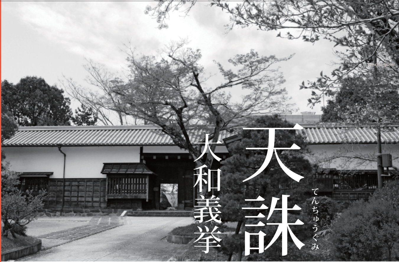
市立民俗資料館 長屋門