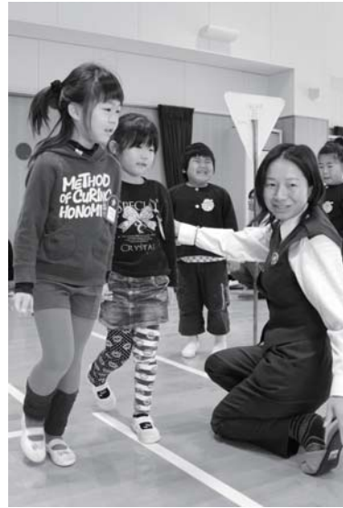
巡視員の指導のもと、楽しく学習

子どもたちを巻き込んだ交通事故が全国で多発しています。五條市では子どもたちを事故から守るため、市内の保育所で来年度小学校に入学する児童を対象に新入学児童交通安全