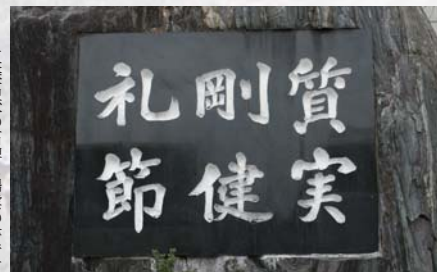
五條高校の石碑も掃雲の書です

ができます。このことから、掃雲は五條の人から非常に親しまれた書家だったことがうかがえます。普段何気なく目にする様々の物にも、それぞれが物語を持っています。日常生活でも、そうした目で物を見れば、日々の生活もまた変わったものになるかもしれません。