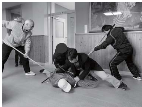
刺す股を使用して不審者を確保

子どもたちの安全を守るため、五條警察署員と市危機管理課職員との指導のもと、阪合部小学校で児童87人と教職員14人が参加して不審者侵入訓練が実施されました。五條警察署員が不審者に扮し「子どもに会わせてくれ」と学校を訪れて刃物を出して暴れたという想定で、駆けつけた教員が刺す股を使用して不審者を制圧しました。また、他の教員は生徒を安全な場所へ誘導し、警察に通報しました。 訓練終了後には生徒や関係者が体育館に集まって検討会を開催し、不審者への対応や避難時の注意点など、いざというときの対処の方法を話し合いました。