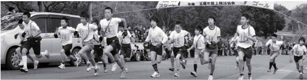
寒さに負けず練習の成果を発揮