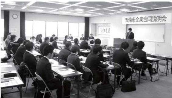
昨年も多くの皆さんが参加しました