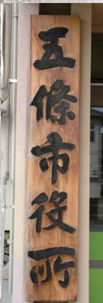
市役所の玄関に掲げられた看板