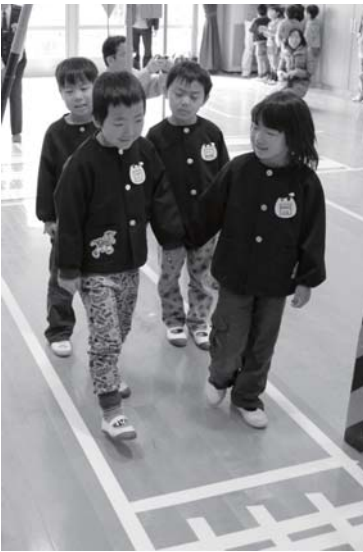
安全に通学できるよう、交通ルールを学びました

全教室を実施しました。五條警察署員や奈良県警察交通巡視員の指導のもと、子どもたちは横断歩道の渡り方や信号機の意味など、交通ルールを学びました。