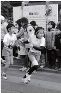
力を合わせてタスキをつなぎました