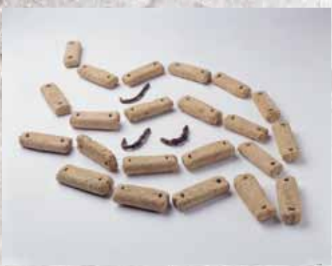
塚山古墳出土の土錘と鉄製釣針

奈良時代の初めに完成した『古事記』『日本書紀』(記紀)を読むと、筥や梁といった竹製の漁具を操り、鵜飼に長けた者が、当時阿太の地にいたことがうかがえます。そこで連想されるのが、漁撈を生業とし、竹細工にも秀でていたといわれる「隼人」です。 隼人とは、近畿地方中央部にあった政権が九州南部に住む人々を指した呼称で、中央政権が辺境とみなした地域を服属させる意識の表れ、とされています。『日本