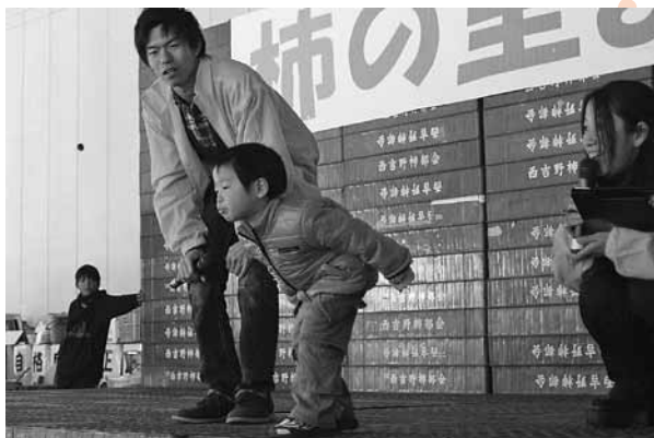
恒例の「柿の種飛ばし」にチャレンジ