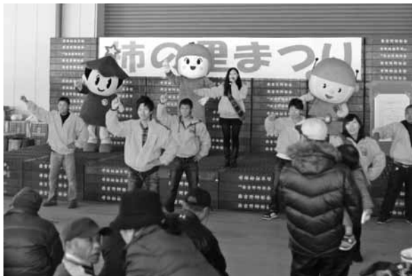
ゴーカスターのダンスで盛り上がる会場

部が中心となつて企画され、今年で11回目を迎えます。会場では、柿の詰め放題や柿の種飛ばしなどのイベントが開催され、来場者は楽しい時間を過ごしていました。