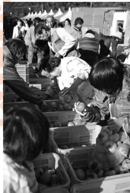
柿の詰め放題コーナーは大盛況