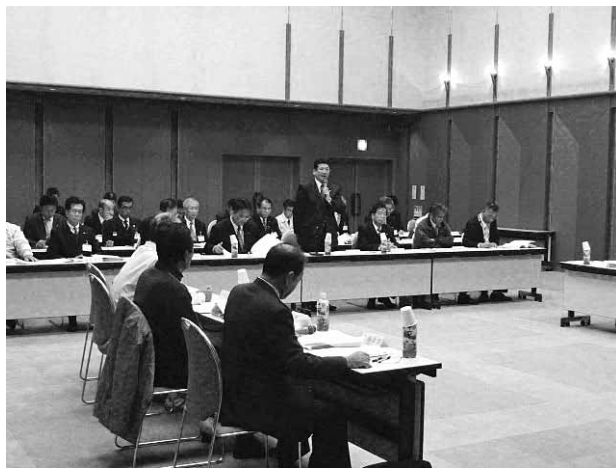
災害からの迅速な復旧に取り組んでいます

一昨年9月に襲来した台風十二号に伴う記録的な豪雨により、大塔町は甚大な被害を被りました。この度、災害からの復旧事業等がどの程度進んでいるかを確認するため「五條市大塔町災害復旧・復興計画進捗状況報告会」を開催しました。市では、「五條市大