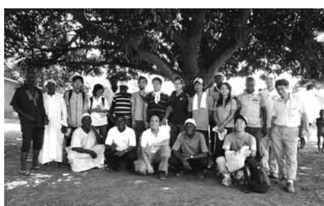
プロジェクトに関わった村の人たち

さて「突然プロジェクトと言われても?」という方に。これはJICAの行う技術協力のひとつです。日本の昔ながらの稲作ノウハウを、ガーナでできる形に変えて伝えていきます。ひ