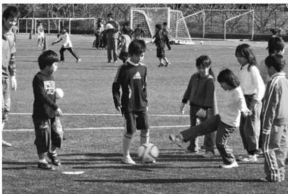
サッカーで楽しく友達作り

ジュニアサッカー教室が上野公園多目的グラウンドで開催され、市内の小学生約100人が参加しました。この教室は、五條市サッカー協会の協力のもと、サッカーを通じて、児童の友好や心身の健全な育成を図ることを目的としています。子どもたちは柔らかな人工芝のグラウンドでいきいきとボールを追いかけて、楽しく充実した時間を過ごしました。また、初めて出会う他校の友達とも、練習やミニゲームを通して仲良くなることができました。