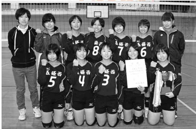
1、2年生で構成する新チームも県大会で優勝