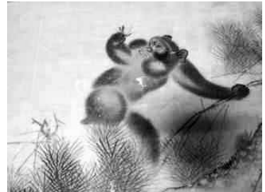
森猿仙画「松に猿図」(部分)

月曜日休館(月曜が祝日の場合は翌日) 入館料(大人300円、小人200円) ■藤岡家住宅 ☎22・4013 (近内町526)