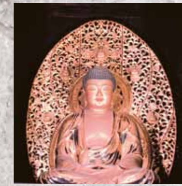
榮山寺の薬師如来坐像

榮山寺の本堂は、少なくとも15世紀前半と16世紀中頃の2度、火災で焼失し、その都度再建されたことが古文書の記述でうかがえます。現在の本堂は、棟木の墨書によると天文24年(1555)に再建され、江戸時代を中心にしたたびたび修理されてきました。