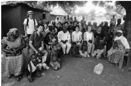
ナパイリでシアバター作りを体験

したものを挽いた後、ポンポン菓子を作るような焼き器に入れ、手や足でそれを回しながらゆつくりと焼いていきます。それを取り出し、もう一度挽き器にかけ、水を足すとジュースのミロの様な液体が得られます。