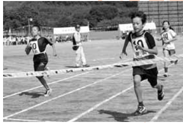
天候に恵まれ、選手は気持ちよい汗を流しました