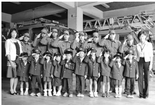
キッズボリスが安全運動を呼びかけて 消防本部を訪れました(西吉野幼稚園児)