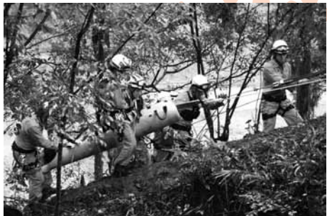
起伏の多い山の中でも、安全にけが人を搬送します

五條市消防本部は中南和消防相互応援協定に基づき、五條、中吉野、吉野の3消防本部と5万人の森(北山町)で合同訓練を行いました。 山岳地帯で登山者3人が滑落。五條市消防本部のみで対応できないため隣接消防に応援を要請する想定で山岳救助訓練を実施しました。多くの関係者が見学中、3消防本部隊員は連