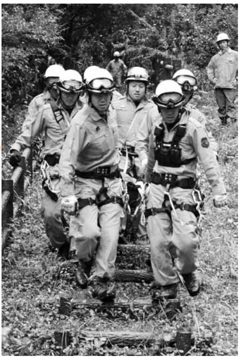
実際の事故さながらに訓練を実施

五條市消防本部は中南和消防相互応援協定に基づき、五條、中吉野、吉野の3消防本部と5万人の森(北山町)で合同訓練を行いました。 山岳地帯で登山者3人が滑落。五條市消防本部のみで対応できないため隣接消防に応援を要請する想定で山岳救助訓練を実施しました。多くの関係者が見学中、3消防本部隊員は連