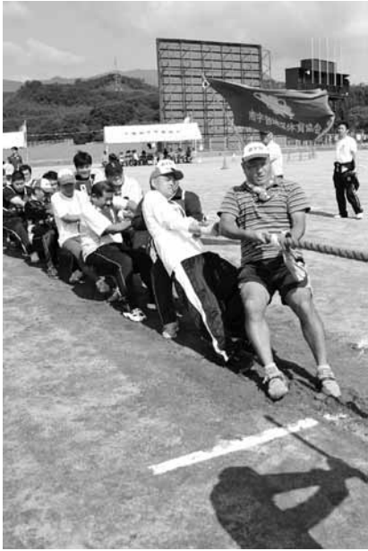
綱引き競技を制したのは南宇智地区

第53回 今回で53回目を迎える市民体育大会が上野公園で行われました。地域を代表して出場した選手の皆さんは、リレーやジャンボ縄跳び、綱引きなどの競技に全力で取り組み、応援を受けながらさわやかな汗をかきました。