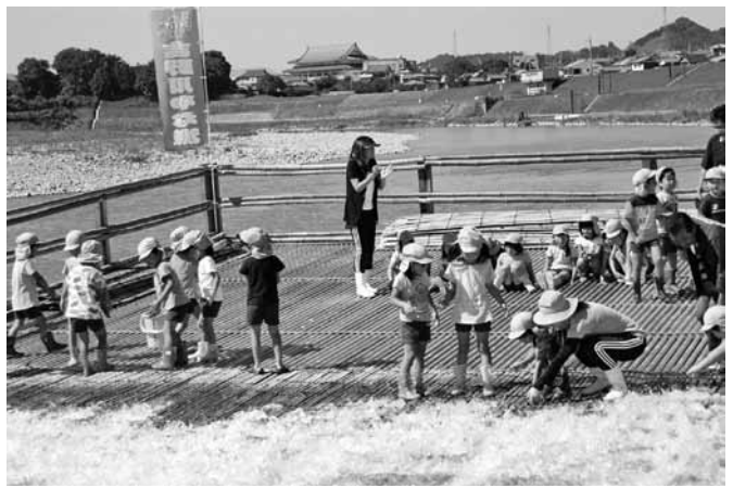
五條の秋の風物詩となっているやな漁