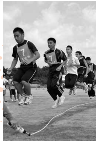
ジャンボ縄跳びは阪合部地区が優勝