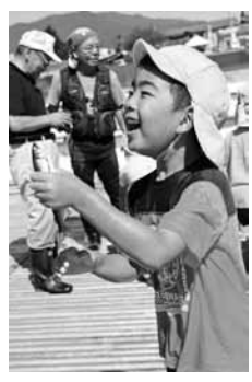
子どもたちは元気な鮎に歓声を上げました

に落ちてくる鮎をつかみどりしていました。また、捕まえた鮎は河川敷で串焼きにして、園児がおいしくいただきました。