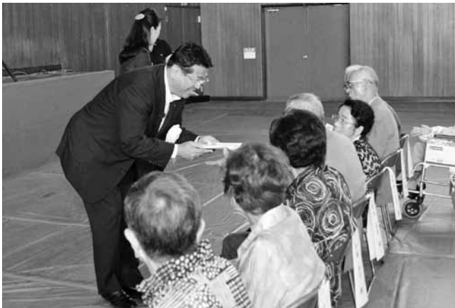
米寿を迎えた皆さんをお祝いする太田市長

米寿を迎えた皆さんに太田市長からお祝いの品が手渡されたほか、漫談や歌謡ショーなどが行われ、会場は笑顔であふれていました。