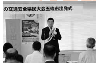
太田市長も「悲惨な事故を無くそう」と呼びかけました

9月21日から10日間、秋の交通安全運動が全国一斉に実施されました。五條市でも交通事故を無くすため、五條警察署や関係機関が協力して様々な啓発活動が実施されました。