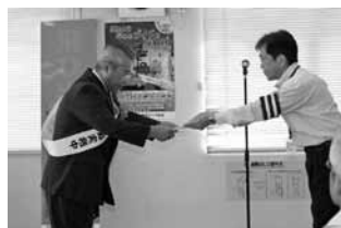
ロータリークラブから交通安全看板を寄贈していただきました