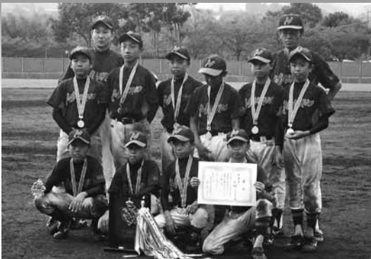
準優勝 牧野ジュニアーズ