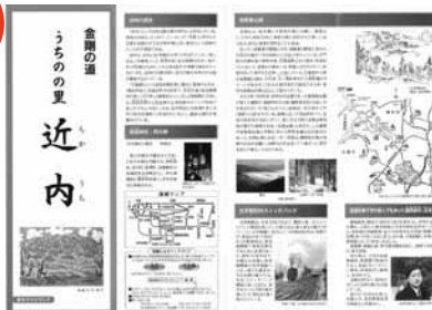
金剛の道 うちの里 近内マップ

の大野」は、JR北宇智駅西側の丘陵地帯などと説明されることが多いようです。昭和二十年、北宇智駅から金剛山に結ぶ道を、藤岡玉骨が俳句に詠みました。帰りにないざ故郷は 麦の秋 玉骨 大阪宰相山の住居が 戦争で罹災し、帰郷したときの句です。玉骨が戻って以来、藤岡家には高濱虚子など優れた俳人が集うことになりました。