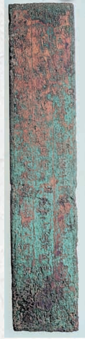
▽山代忌寸真作墓誌(複製品)

そのうち、東阿田町の山代忌寸真作墓誌(奈良時代)は、全面を鍍金した縦28cm、横5.7cmの銅板製で、表面にタガネで野線を彫り、76文字を3行にわたって刻んでいます。