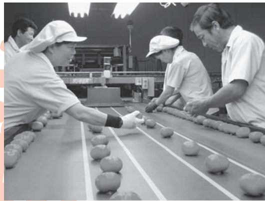
ハウス柿の選果風景

J Aならけん西吉野柿選果場で、ハウス柿の出荷が始まりました。ハウス柿は全国でも生産量の少ない希少価値の高いフルーツです。中でも、五條市周辺地域の生産量は全国シェア7割を占め、日本一です。 甘みが強く食味が良いと評判の五條のハウス柿。秋の味覚のトップバッターとして、首都圏や北海道、東北方面等の市場へ出荷されます。