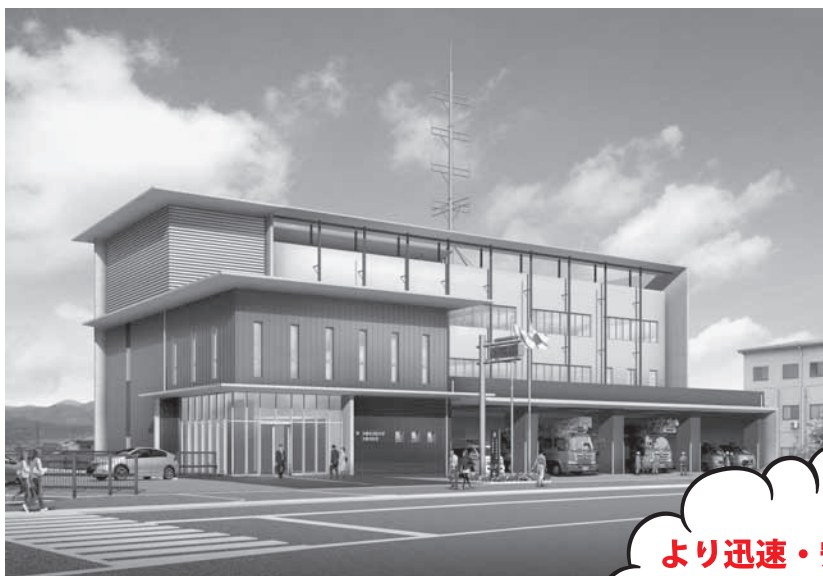
新消防庁舎の完成イメージ