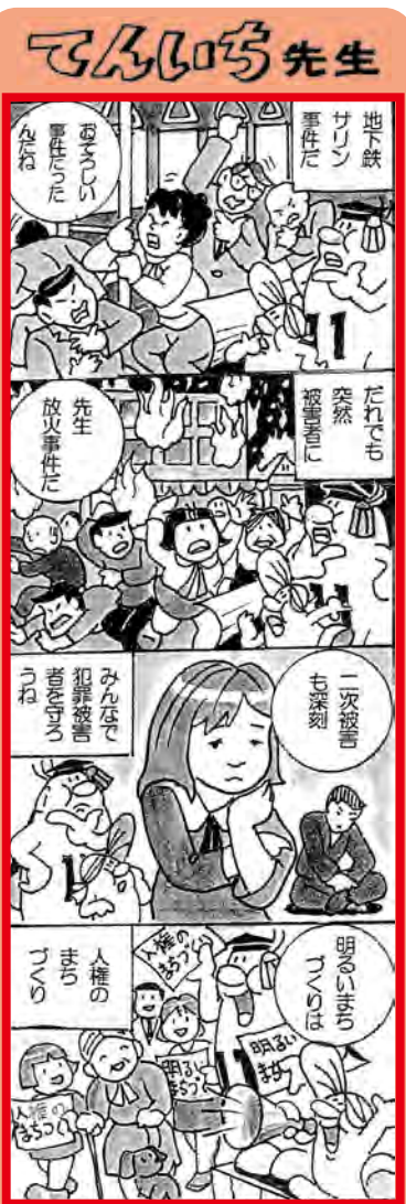
■問合せ 人権施策課 本庁(内線286)