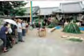
蓮華祭りが行われる地福寺

吉野山金峯山寺の蓮華会(蛙飛び行事)を思い浮べますが、五條でも金剛山以来1000年を超える伝統の行事が行われています。(※金剛山の転法輪寺は、昭和25年に再建されました。)