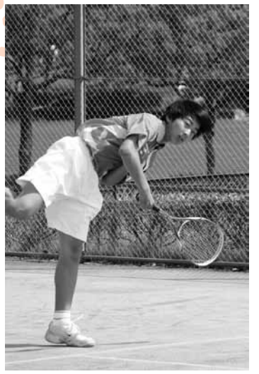
ソフトテニス（上野公園）