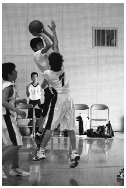
バスケットボール（五條西中学校）