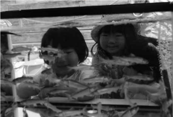
吉野川に住む魚に子どもたちは興味津々