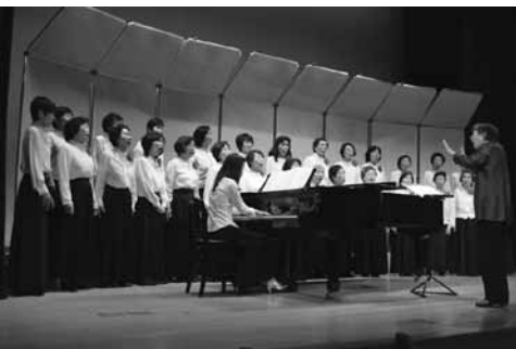
美しい歌声に来場者は聞き入りました

中央公民館をはじめ、市内の公民館で活動している団体やサークルが一年間の学習の成果を発表する第35回五條市公民館祭が開催されました。会場となった中央公民館と市民会館には書道や絵画、写真などの力作が展示され、多くの来場者が訪れました。また、市民会館では朗読や尺八、合唱などの発表が行われ、練習の成果を存分に発表していました。