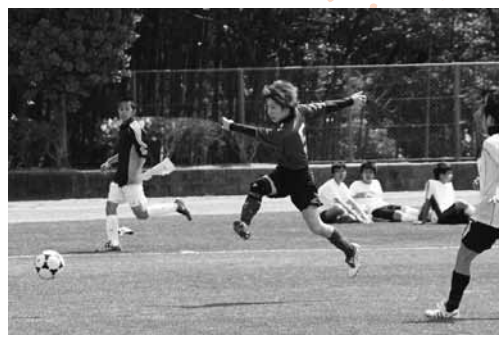
サッカー（上野公園）