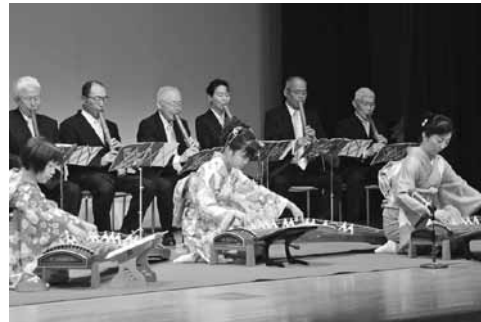
子どもから大人まで学習成果を披露

中央公民館をはじめ、市内の公民館で活動している団体やサークルが一年間の学習の成果を発表する第35回五條市公民館祭が開催されました。会場となった中央公民館と市民会館には書道や絵画、写真などの力作が展示され、多くの来場者が訪れました。また、市民会館では朗読や尺八、合唱などの発表が行われ、練習の成果を存分に発表していました。