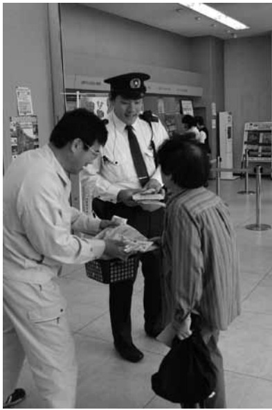
銀行ATM前で振り込め詐欺防止をよびかける五條警察署員と市職員

現在、奈良県では高齢者を狙った振り込め詐欺が多発しています。1月から5月8日までの間に、すでに23件、6950万円の被害が発生しました。わずから5か月程度の間、昨年1年間の被害額を大きく上回る危機的な状況が続いています。奈良県下の被害が非常に大きいため、現在奈良県では「振り込め詐欺多発警報」が発令されています。