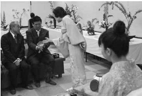
お茶席に訪れた大田市長、益田議長