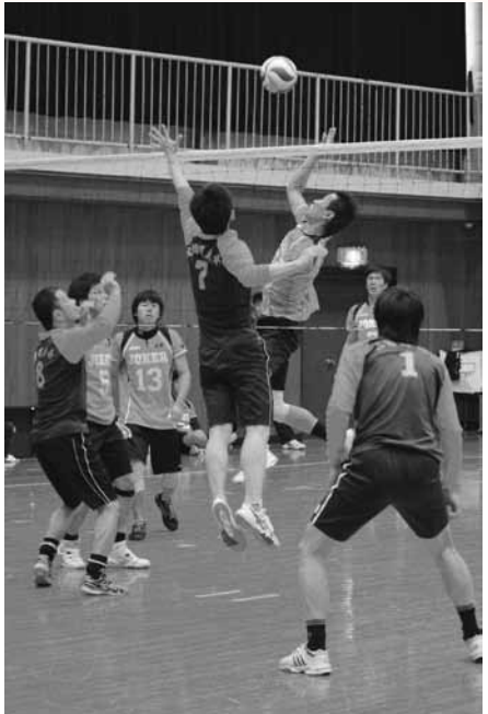
バレーボール（中央体育館、五條中学校）

市内でサッカー、バレーボール、バスケットボール、ゲートボールなどの球技を行っている皆さんが日頃の練習の成果を競い、交流を深めながら健康を増進しようとして、市民球技大会が開催されました。競技は上野公園を中心に市内の体育館などで開催され、参加した皆さんはさわやかな汗を流しました。熱戦の結果は広報五條7月号でお知らせします。