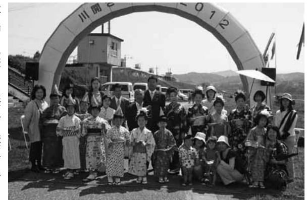
歌と踊りを披露した五條子ども読書会の皆さん

五條市に住む人々の心のよりどころである吉野川に親しみ、その大切さを考えようと、今年も河川敷で川開きフェスタが開催されました。春風の心地よい会場では吉野川に生息するアユやカメ、ザリガニなどのミニ水族館コーナーや消防隊員によるはしご車体験、大道芸なども行われました。こいのぼりが雄大に泳ぐ会場は終日子どもたちの笑顔と歓声であふれていました。