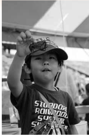
ザリガニなどに直接触れられるコーナーは大人気

五條市に住む人々の心のよりどころである吉野川に親しみ、その大切さを考えようと、今年も河川敷で川開きフェスタが開催されました。春風の心地よい会場では吉野川に生息するアユやカメ、ザリガニなどのミニ水族館コーナーや消防隊員によるはしご車体験、大道芸なども行われました。こいのぼりが雄大に泳ぐ会場は終日子どもたちの笑顔と歓声であふれていました。