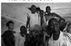
まだまだ元気な一年生