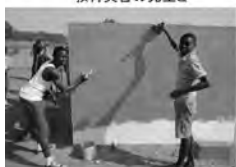
新しいトイレのペイント