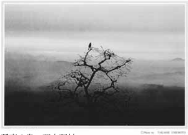
孤高の鳥～西吉野村～ (1991年3月撮影)

奥吉野の壮大な風景を撮り続けてきた写真家、梅本隆氏。昨年9月の台風12号で被害を受けた大塔町、そして西吉野町の美しい大自然の写真展を、復興応援チャリティー企画とともに開催します。