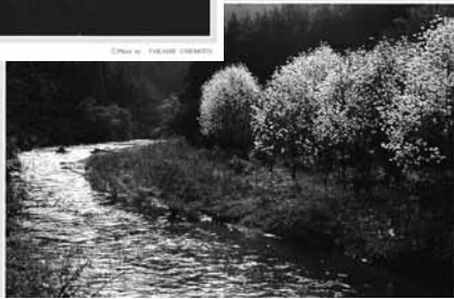
悠久の流れ～西吉野村～ (1992年4月撮影)