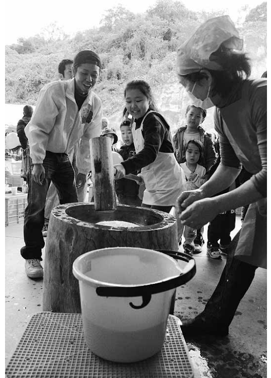
子どもたちも手伝った餅つき。できたての餅は来場者にふるまわれました

興のために企画され、今回で10回目を迎えます。約4600人の来場者が訪れた会場では、柿の種飛ばし大会や、五條市のイメージキャラクター「ゴージャスター」や、せんとうんのショーなどで会場は盛り上がりました。