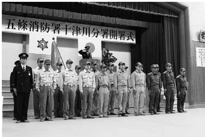
21人の隊員が十津川分署の管内を守ります

五條市消防本部は、十津川村折立に十津川分署を設置し、常備消防が整備されていなかった十津川村内全域を管轄範囲として11月28日から運用を開始しました。今まで役場職員が行っていただけが人や急病人の病院への搬送などは、今後、高度な機器を搭載した救急車に救急救命士が同乗して行うことができます。また、災害や火災に対しても訓練を重ねた隊員が常駐で対応でき、管轄地域の住民の安全、安心を守る体制が整いました。