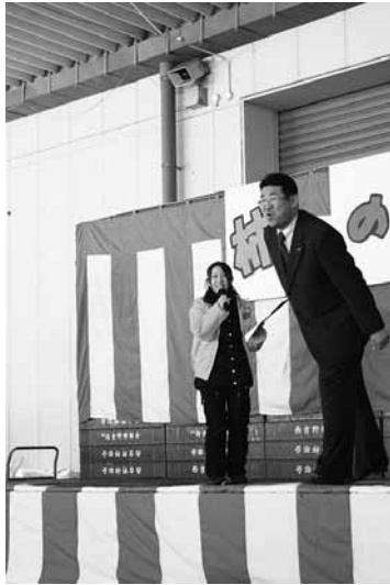
柿の種飛ばしには太田市長も参加して会場を盛り上げました