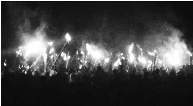
たいまつとともに練り歩く人々

ファイヤーフェスティバル 12月最初の月曜日、ファイヤーフェスティバルというものがタマレでありました。少し前から同僚の先生が「去年の写真だ」と見せてくれていて知っていました。今回僕はタマレで活動する隊員と一緒に近くのジソナイリという地域で参加することにしたので