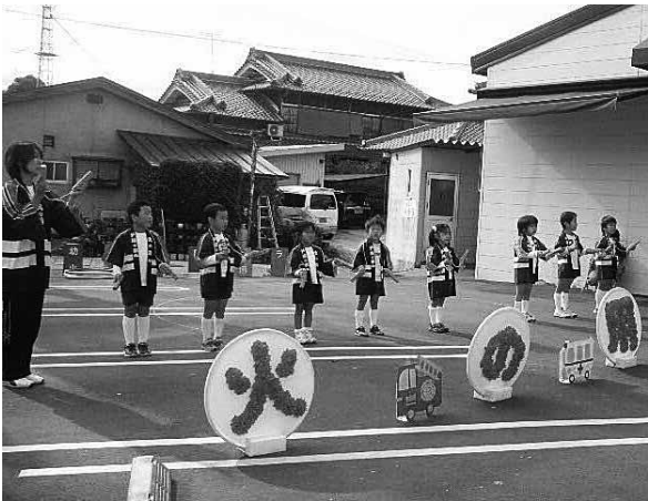
かわいい園児が防火をPR

秋季火災予防運動の一環として、五條市幼年消防クラブ員である南宇智保育所の年長児8人が吉野ストア五條店で防火キャンペーンを実施しました。 防火ゆうぎの披露や住宅用火災警報器の普及啓発チラシの配布などを行い、買い物客や地域の住民、また保護者の皆さんに防火を啓発することができました。