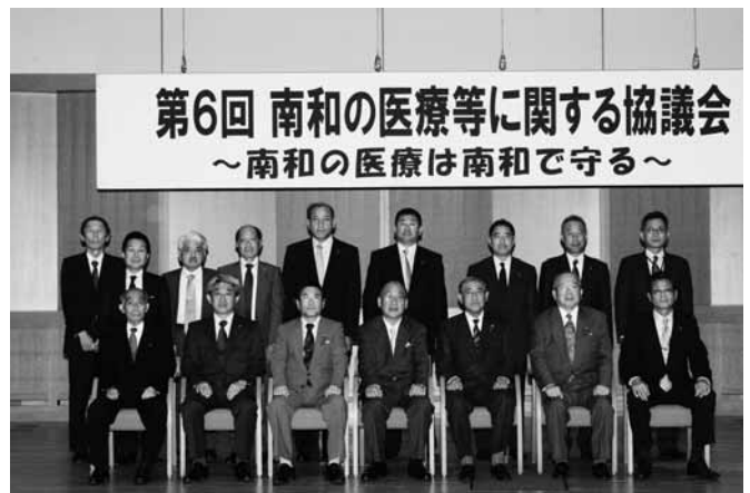
南和地域の各市町村長が協議を重ねています

「第6回南和の医療等に関する協議会」が斑鳩町のいかるがホールで開催され、協議会会長の奈良県知事をはじめ、南和地域の各市町村長が出席して、受益と負担のあり方などが協議されました。今回の協議では、施設の整備や運営の費用に対して各市町村ごとの負担割合や、新たな病院を運営する組織として、一部事務組合（仮称）南和広域医療組合」の概要を定めた規約案が合意されました。また、基本構想・基本計画については、その骨格が合意されました。 今後は、各構成団体（県・関係市町村）の議会における議決、承認の後、国の設立許可を経て、2月に「一部事務組合」を設立する予定です。