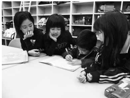
友達と一緒にすると勉強も楽しくなります

通学合宿は、小学校の生徒が家庭から離れて公民館などで寝食を共にしながら共同生活を行い、学校に通う取り組みです。合宿では、身の回りのことを子どもたちが協力して行います。今回は大塔小学校の全児童も参加し、牧野小学校の児童と一緒に牧野公民館で宿泊しました。子どもたちは初めて会う友達ともすぐに打ち解け、夕食のカレー作りや、夜に行われたダンスなど、楽しい時間を過ごしました。最後に、合宿の思い出を作文にして発表した子どもたちは、友達が増えて嬉しかったことや、お世話になった地域の皆さんへの感謝の言葉を述べ、協力することの大切さを学んでいました。