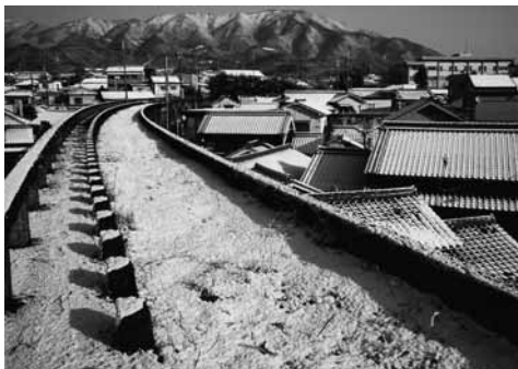
写真：冬の五新鉄道跡