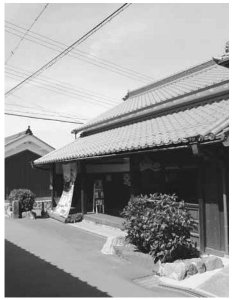
母屋の道向かいにある立派な米蔵

6月22日(水) 水無月のランチサロン。高天彦神社から橋本院へ案内します。緑の葛城山のふもとを紫陽花を見ながら700mほど歩きます。橋本院では、住職の案内もあります。詳しくは問い合わせてください。