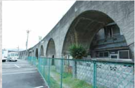
五新鉄道のアーチ橋

運動開始から20年近く、この間、日本の内閣は14回も交替し、その間の五條の人々の労苦は想像に絶するものがあったでしょう。こうして五新鉄道の建設工事は始まりました。しかし、この鉄道の建設を巡っては、その後も紆余曲折が続き、五條の昭和史に暗い影を落とすこととなります。(来月号につづく)