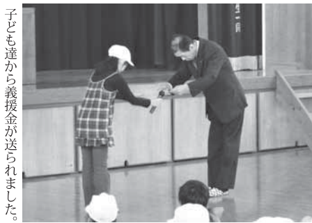
子ども達から義援金が送られました。

宇智小学校では9年前から、毎月3日を「アル3の日」と定めてアルミ缶やプルタブを子どもたちが小学校に持ち寄り、回収しています。 今回、この取り組みによって得たお金を東日本大震災の被災地に寄付するため、義援金の寄贈式が行われ、生徒の代表者から今井郵便局長に手渡されました。 日頃から行ってきたアルミ缶の回収が被災地の支援につながり、子ども達は積み重ねることの大切さを学ぶ事ができました。