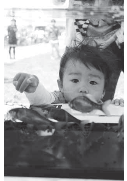
水槽の魚に、子ども達は興味津々です。

古くから五條市に住む人々に親しまれてきた吉野川の恵みを見直し、川で遊び、楽しみながらその環境について考えようと、川開きフェスタが吉野川河川敷で行われました。 会場には吉野川に生息するアユやウナギなどの魚が展示されたほか、カメやザリガニに触れることができる水槽も用意され、会場は子ども達の笑顔と歓声であふれました。