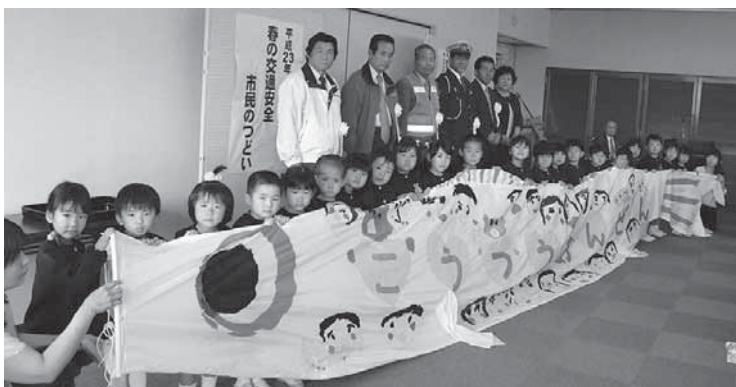
願いを込めて園児が描いた交通安全こいのぼり。

五條市民球技大会が上野公園や市内の体育館などの会場で開催され、約1300人が参加して汗を流しました。 バレーボールやサッカー、バスケットボールなどの競技に参加した皆さんは日頃の練習の成果を十分に発揮し、会場は熱気に包まれました。競技の結果は、追って広報五條等でお伝えします。