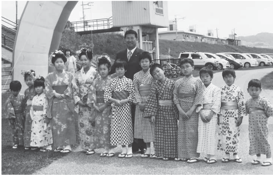
流しびなをテーマにした踊りがオープニングを飾りました。