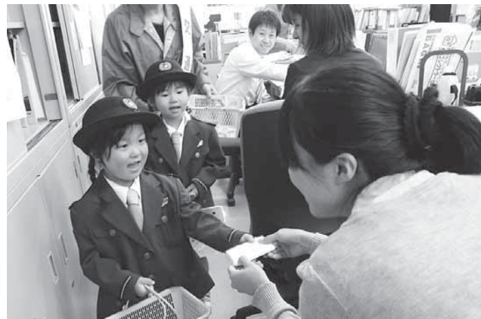
キッズポリスが事業所を訪問して、交通安全を呼びかけました。

悲惨な交通事故を無くそうと、5月11日から10日間、春の交通安全県民運動が実施されました。 運動のスタートとなる出陣式では、牧野保育所の園児が描いた交通安全こいのぼりが披露され、後日吉野川河川敷にあげられました。また、五條幼稚園の園児によるキッズポリスが1日警察官として市役所をはじめ市内の事業所を訪問し、交通安全を呼びかけました。