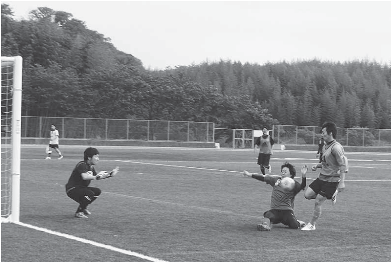
上野公園で行われたサッカーには多くの皆さんが参加しました。