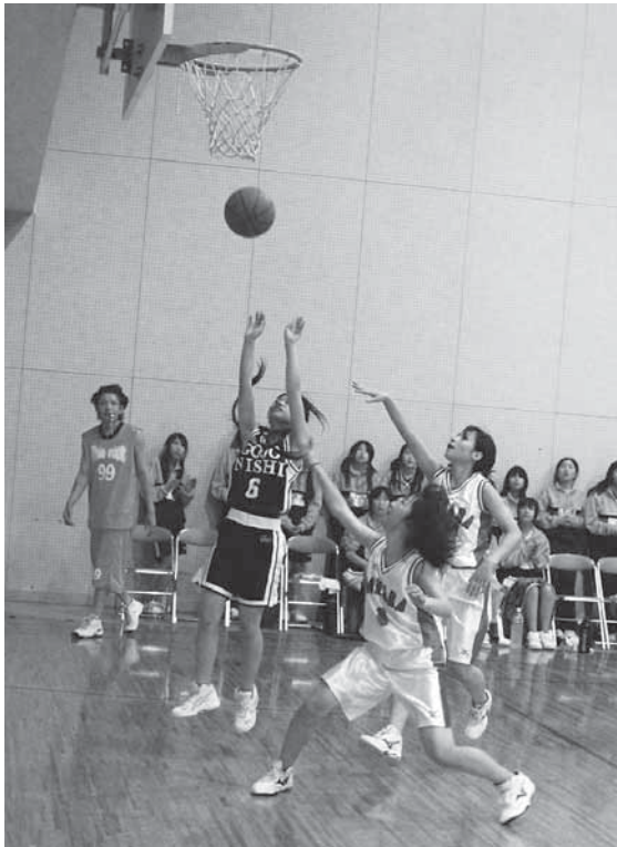
ディフェンスをかわしてシュート。接戦が繰り返されたバスケットボール。

五條市民球技大会が上野公園や市内の体育館などの会場で開催され、約1300人が参加して汗を流しました。 バレーボールやサッカー、バスケットボールなどの競技に参加した皆さんは日頃の練習の成果を十分に発揮し、会場は熱気に包まれました。競技の結果は、追って広報五條等でお伝えします。