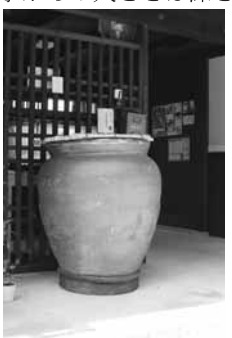
水がめは人が入れるほどの大きさです