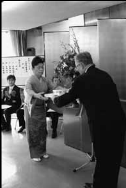
表彰状と記念品が贈られました。