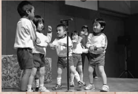
大塔保育所の園児はダンスを披露

また、大塔ふれあい交流館では、11月3日に第14回大塔いきいき文化祭が開催されました。大塔小学校の生徒による和太鼓「夢来太鼓（むらだいこ）」の演奏や、保育所の園児のダンスなどが披露され、見学に訪れた人々の温かい歓声を受けていました。