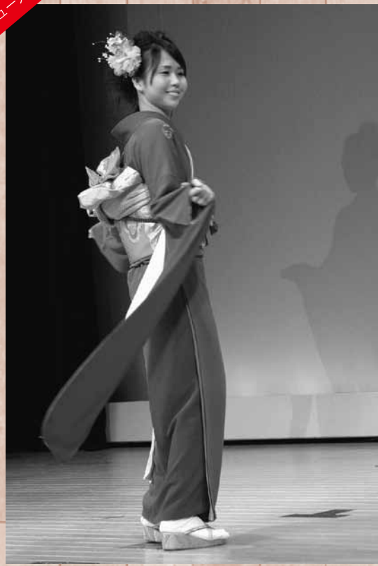
華やかな着付の発表