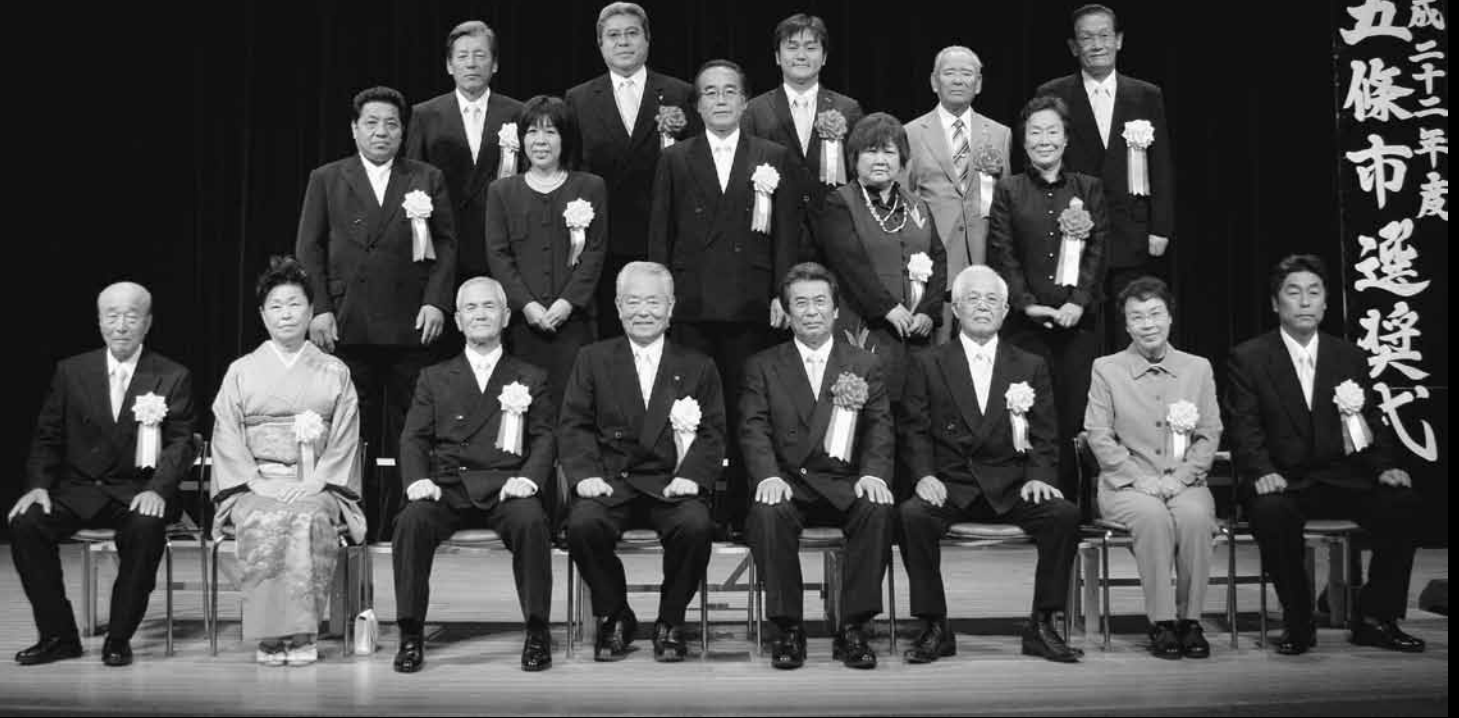
▽前列左から 増田様、小西様、繁野様、吉野市長、川村市議会議長、榮林様、中谷様、東様 ▼中列左から 森本様、井田様、春名様、林様、若菜地区婦人会連絡協議会長 ▼後列左から 榮林副市長、秋本県議会議員、田野瀬代議士代理金山様、中谷自治連合会長、赤井教育長