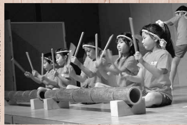
大塔小学校の生徒の皆さんによる夢来太鼓