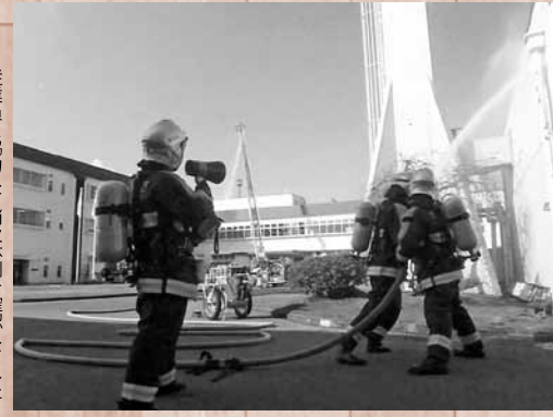
従業員と協力して消火体制を確認しました