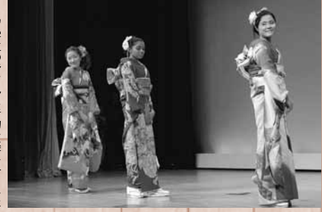
留学生の皆さんも着物を楽しみました