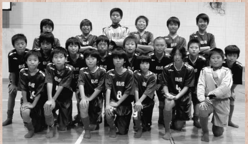
県予選を勝ち抜いた五條FCの皆さん

五條フットボールクラブは、KINSHO カップ第32回奈良県小学生サッカー大会兼第34回関西少年サッカー大会の奈良県予選を勝ち抜き、奈良県代表として関西大会に出場することが決定しました。関西大会は12月11日、12日に堺市立サッカー・ナショナルトレーニングセンターで開催される予定です。