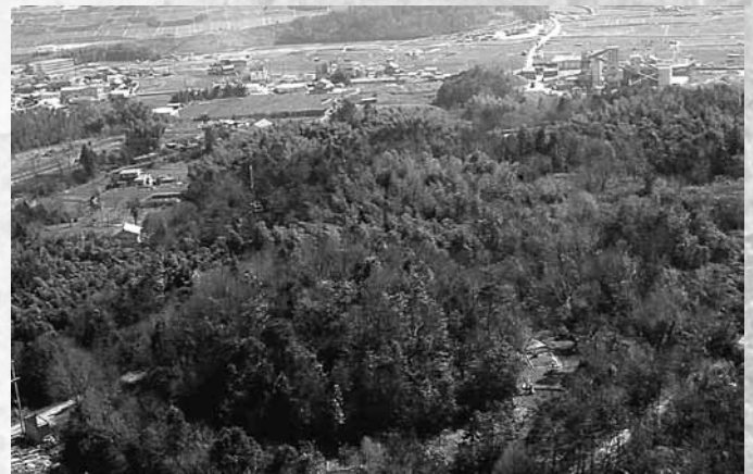
写真の手前にある丸い部分が近内鐘子塚古墳

晩秋から春にかけての時期は、草が枯れ、蜂やマムシもいないので古墳を見学しやすくなります。田畑を荒らさないように気をつけながら、古墳時代に思いを馳せてみてはいかがでしょうか。