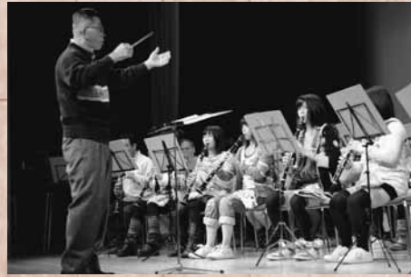
迫力ある吹奏楽の演奏