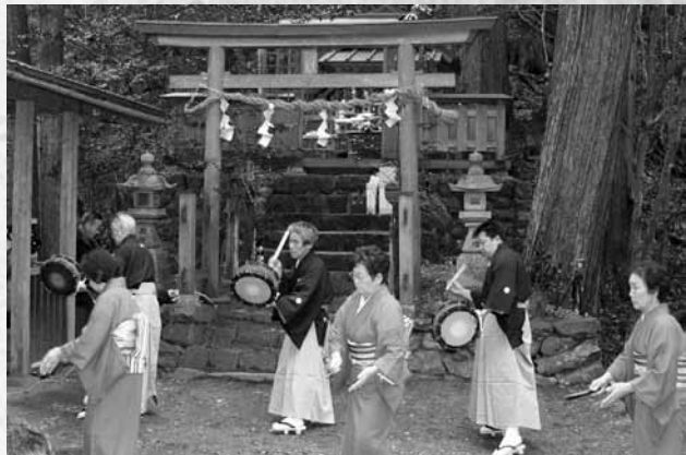
篠原踊(平成22年1月25日撮影)

篠原踊も山間部の民俗芸能の貴重な事例として、昭和30年12月26日、奈良県指定無形民俗文化財に指定されました(指定名称は「篠原おどり」)。過疎化や高齢化が進み、伝統芸能を受け継ぐことは難しくなっていますが、保存会を中心とした皆さんの地道な取り組みが続きます。