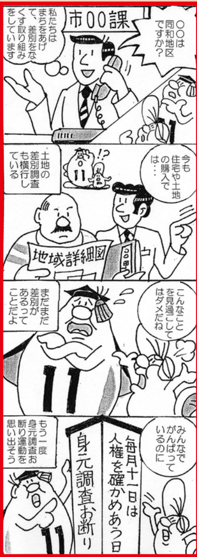
■問合先 人権施策課 本庁 (内線286)