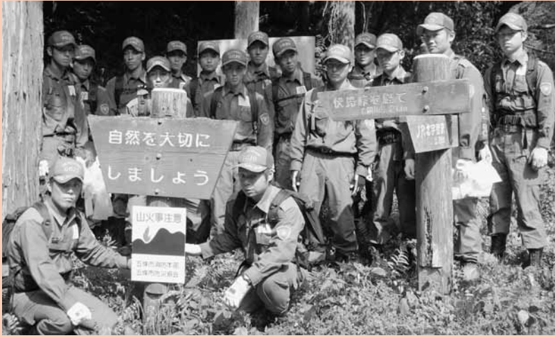
山火事防止の看板を金剛山に設置しました