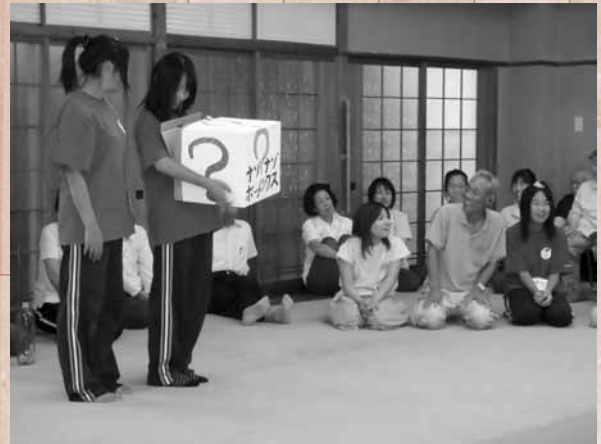
入所者とゲーム等で楽しく交流

ボランティアグループ「風のつばさの会」が養護老人ホーム花咲寮を訪問しました。クイズやゲーム、歌などで、入所している皆さんと交流し、心温まる楽しいひとときを過ごしました。この訪問活動は、風のつばさの会の恒例行事として、毎年行われています。