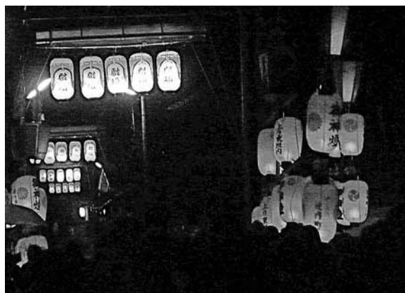
近内御霊神社の秋祭り(昨年撮影)