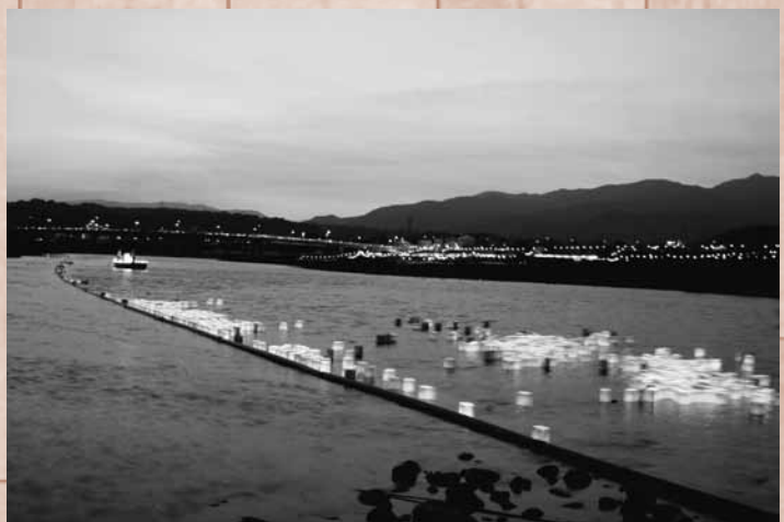
辯天宗のとうろう流しも行われました。