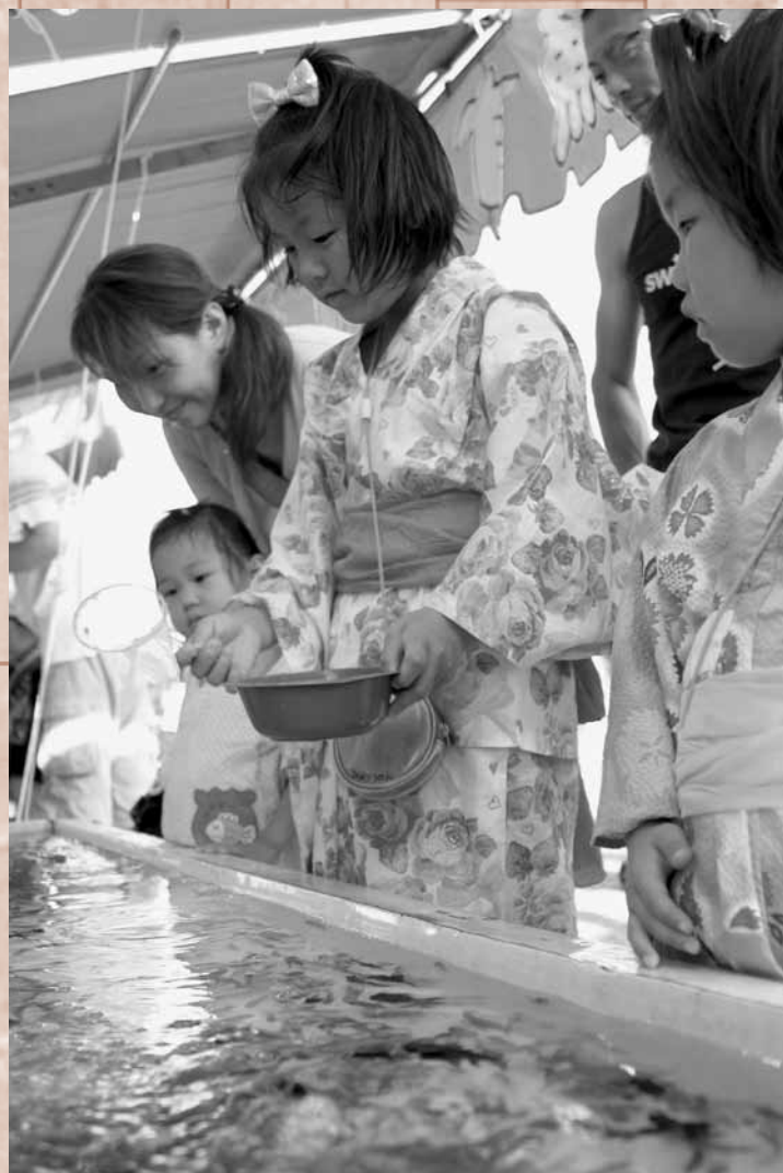
金魚すくいを楽しむ子供たち。たくさんの夜店が祭りの雰囲気盛り上げました。