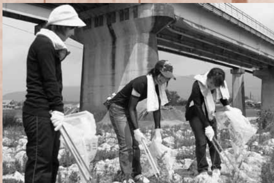
吉野川河川敷をきれいに清掃。

手づくりイカダ下りコンテストに参加した皆さんはアイデアを凝らしたイカダでパフォーマンスとタイムを競いました。また、鮎やうなぎ等の川魚のつかみ取りも行われ、河川敷は家族連れでにぎわいました。