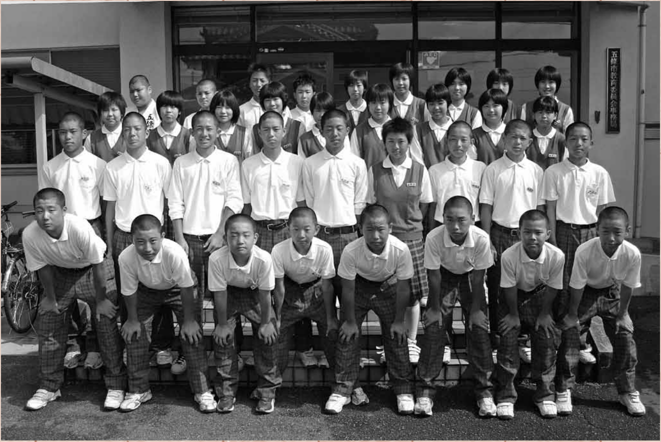
近畿大会への決意を新たにしました。

部活動などでスポーツに取り組み、県大会を勝ち抜いて近畿大会に出場することになった中学生を激励するため、五條市教育委員会で壮行会を開催しました。