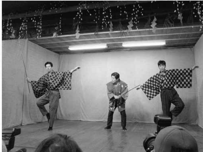
惣谷狂言の「鳥刺狂言」(平成19年1月25日撮影)

民俗学の研究者によると、狂言の種類は、能狂言にあるものや地狂言めいたもの、祝福芸を取り入れたもの、囃子舞の鳥刺舞を狂言仕立てにしたものなど豊富で、長年にわたって取り入れられたとみられるそうです。