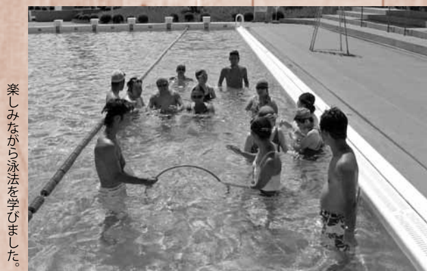
楽しみながら泳法を学びました。