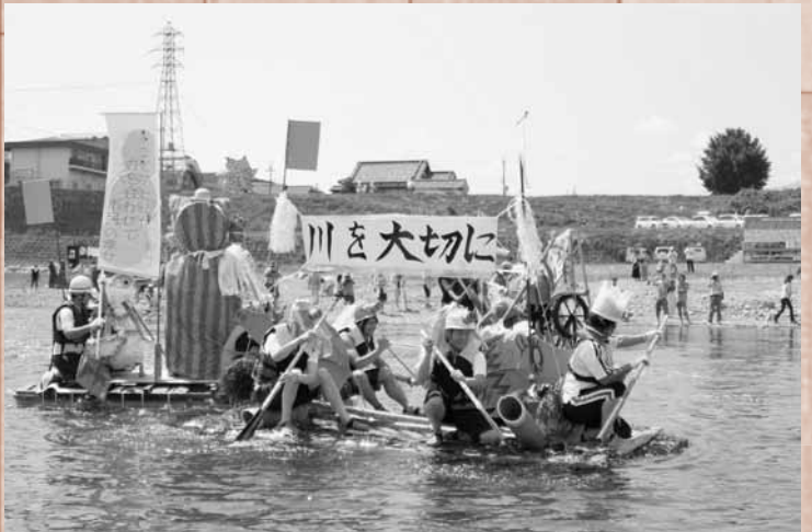
アイデアあふれるイカダでパフォーマンス

吉野川活性化プロジェクトが主催し、川にふれあい、川に関心を持つことで吉野川に活気を取り戻そうと、吉野川フェスタ 2010 かわっ子まつりが開催されました。