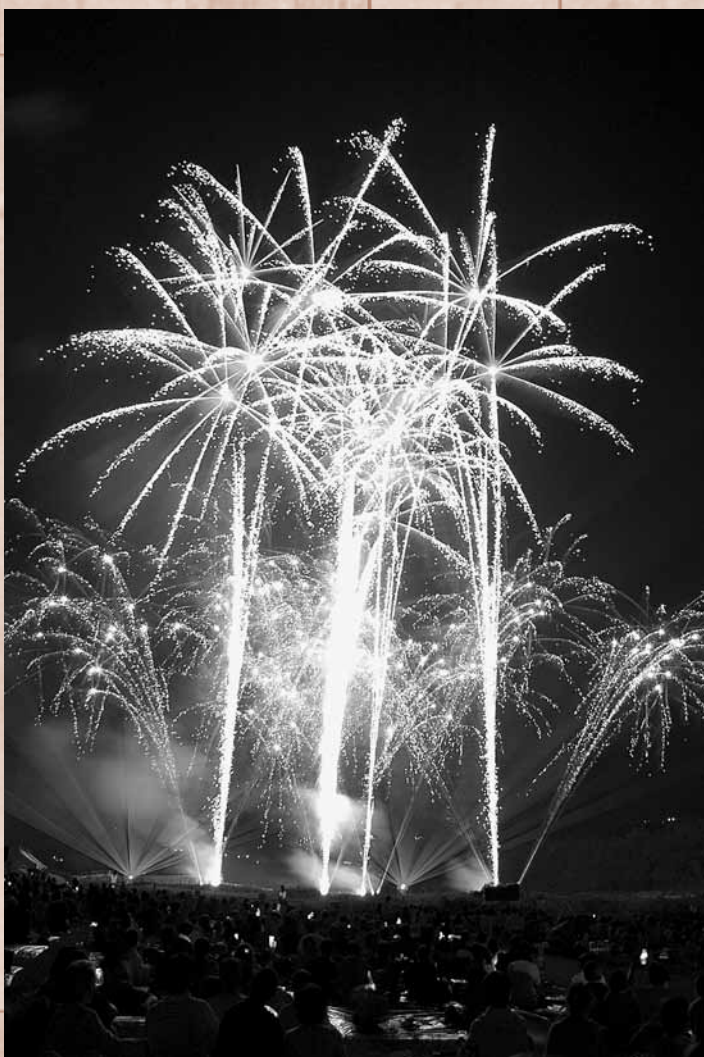
目の前で見る事ができる大迫力の花火が吉野川祭りの醍醐味です。

また、上野公園で行われた吉野川祭り記念野球大会では西吉野フェニックスが優勝しました。