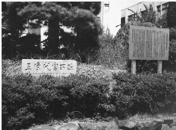
五條代官所跡(いまの五條市役所)