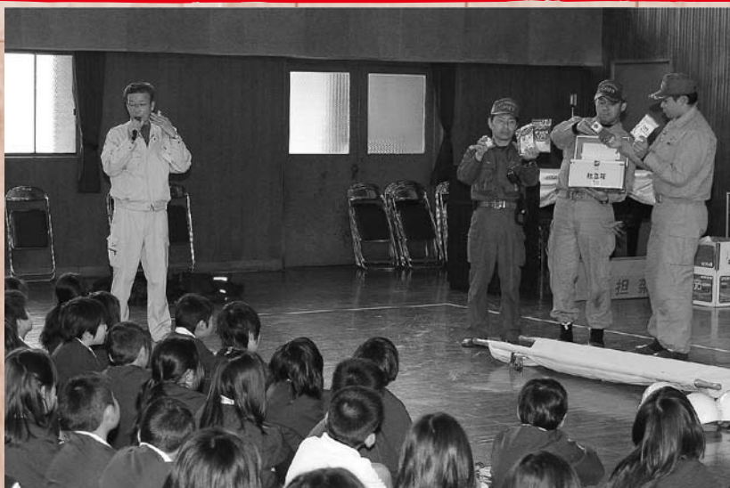
様々な資機材の説明を受け、使い方を学習しました。

また、同会場の展示部門には、保育所、幼稚園や小、中学校の生徒の皆さんの作品をはじめ、いけ花、書道、盆栽など多くの力作が展示されたほか、屋外には地域の皆さんの模擬店も出展され、会場にはたくさんの見学者が訪れました。