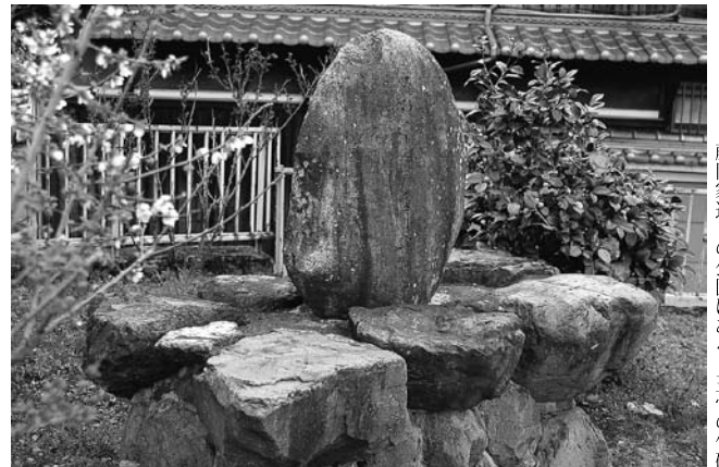
藤岡家近くの公園にある、玉骨の句碑

句碑の背面には「昭和48年10月吉日 近内町一同」と刻まれていました。藤岡玉骨は昭和41年3月6日に亡くなって