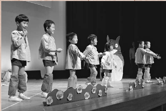
城戸保育所の園児の皆さんは手話で発表にチャレンジ