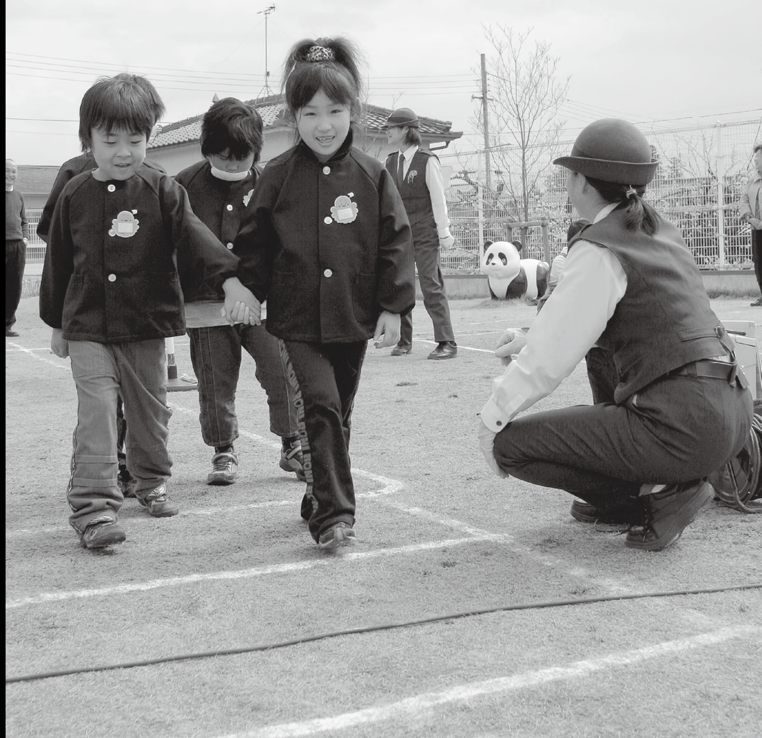
写真：車に気をつけて元気に登校 新入学児童交通安全教室 4月から小学校に入学する子供たちを対象に、新入学児童交通安全教室が市内の各保育所、幼稚園で行われました。奈良県警交通安全教育サポートチームや、五條警察署の警察官の指導を受けて、交通事故から身を守る知識を学びました。