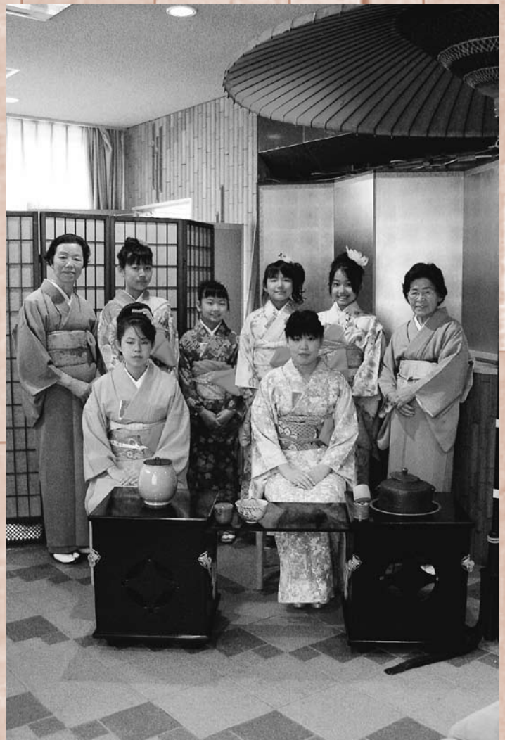
お茶席を用意した西吉野茶道会の皆さん