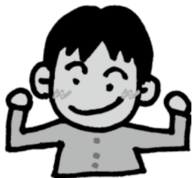
五條市を応援してくれる皆さん

寄附申出書を五條市ホームページからダウンロードし、Eメール、郵便、FAXのいずれかの方法で送ってください。また、連絡をいただければ申出書を郵送します。