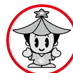
ゴーちゃん (五條市シンボルキャラクター)