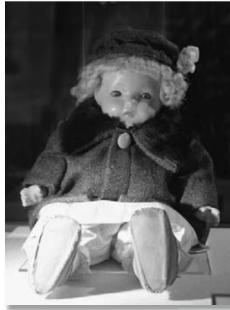
パトリ(賀名生の里歴史民俗資料館蔵)