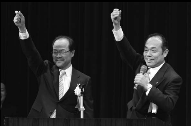
北山議長(写真右)と寒川教育委員長からも祝辞