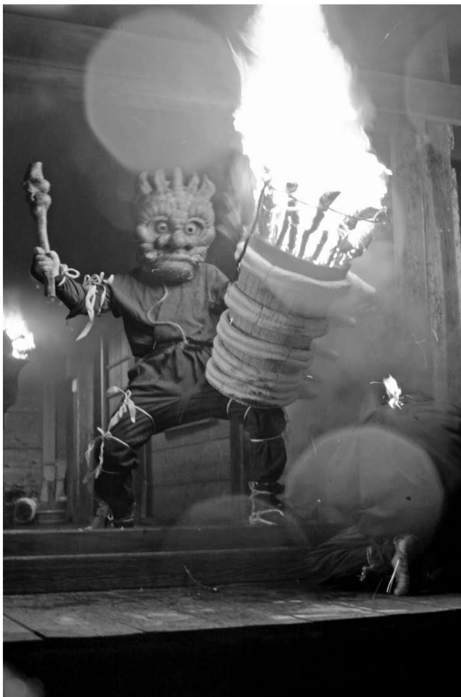
写真：陀々堂の鬼走り