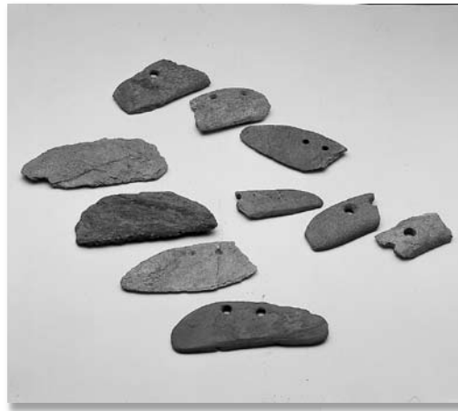
中遺跡で出土した石包丁

実りの秋になりました。稲穂がこうべを垂れる田んぼでは、コンバインが収穫に動き回っていますが、昔は稲刈りも人の手で行われていました。腰をかがめて稲の根元を鎌(かま)で刈る方法は、古墳時代から平安時代にかけて広まったようです。