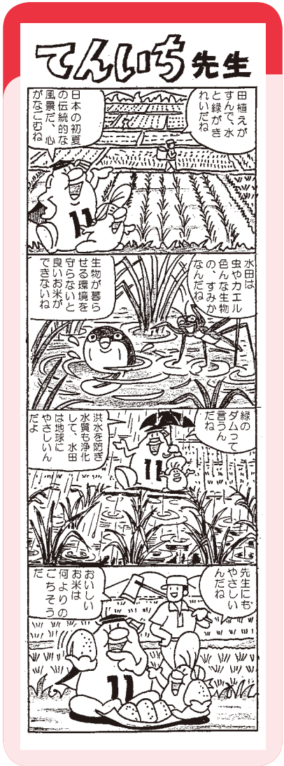
■この記事に関する問合せ先 人権施策課(☎内線286)